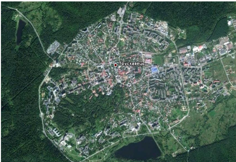
Рис. 2. Бальнеологічний курорт Передкарпаття – місто Трускавець.

Передкарпаття простягається порівняно вузькою смугою між долиною Дністра та північно-східним підніжжям Українських Карпат. Численні річки, що стікають з гір, розчленували Передкарпаття на низку широких долин, між якими є видовжені вододільні височини. У долині Верхнього Дністра було багато боліт, які тепер майже повністю осушені. Міста цієї території розташовані, здебільшого, на берегах річок. Зокрема, Моршин і Трускавець (рис. 2) розвивалися як перспективні центри видобутку солі, проте соляний промисел не виправдав себе, оскільки через вміст у соляній ропі мірабіліту (глауберової солі) така сіль була гіркою та непридатною для вживання. Уже згодом ці міста почали розвиватися як оздоровчі та бальнеологічні курорти.