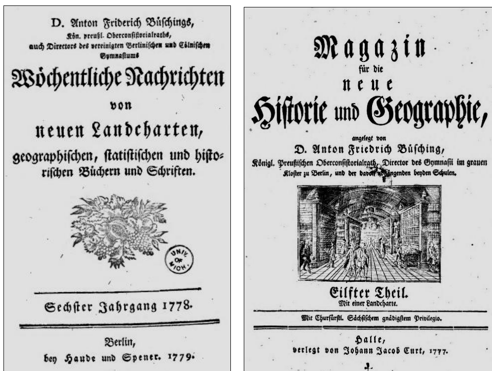
Рис. 5. Титульні сторінки наукових часописів А. Бюшінга “Щотижневі повідомлення про нові карти, географічні, статистичні та історичні дослідження і книги” (Wöchentlichen Nachrichten von neuen Landkarten, geogr., statist. und histor. Büchern und Sachen, 1773–1787) та 25-томного збірника наукових праць, статистично-географічних оглядів, реляцій, щоденників подорожей і матеріалів географічних експедицій “Часопис історії та географії сучасної епохи” (Magazin für die Historie und Geographie der neueren Zeit, 1767–1793)

Майже повністю “забуті” сучасними українськими дослідниками “Щотижневі повідомлення про нові карти, географічні, статистичні та історичні дослідження і книги” А. Бюшінга (див. рис. 5), де непоодинокі трапляються цікаві реляції й анотації рукописів численних тогочасних мандрівників українськими землями, є передруки низки картографічного й статистичного матеріалу з 70–80-х років XVIII ст. тощо [3].