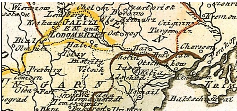
Рис. 3. Новоутворене Королівство Галичини й Володимирії на оглядовій карті Європи А. Бюшінга (фрагмент) [8]

Видатний німецький географ А. Бюшінг у 1772–1775 рр. першим серед науковців систематизував для світової географічної спільноти систему основних географічних відомостей про нову адміністративно-територіальну одиницю Європи – Королівство Галичини й Володимирії – правонаступницю давніших Князівства Галицько-Волинського та Воеводства Руського. А. Бюшінг є автором перших оглядових карт Європи, де відображено цю географічну одиницю (рис. 3).