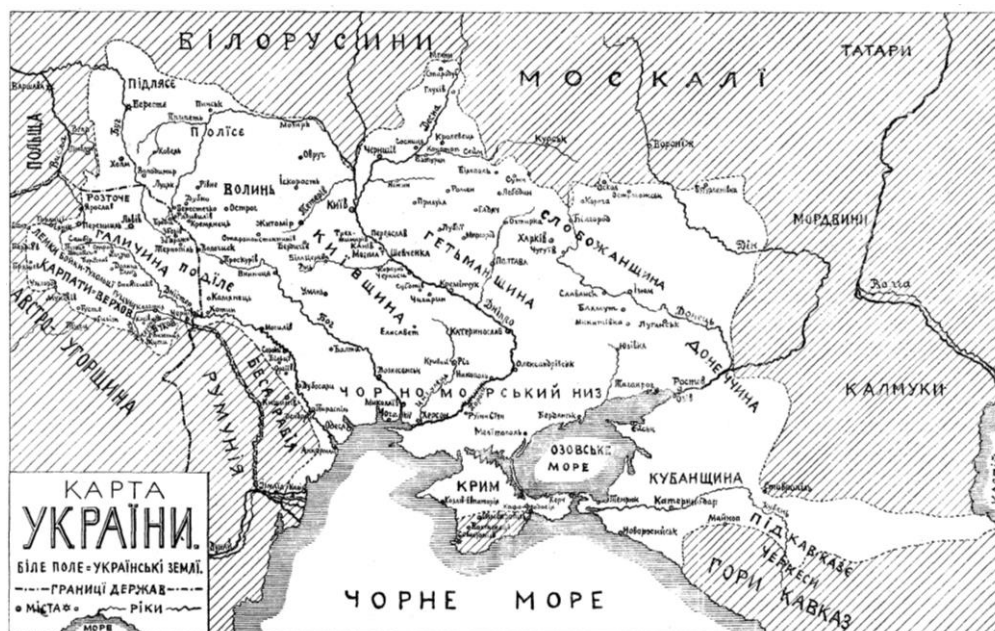
Рис. 4. Українські етнічні землі за М. Грушевським [29]

Згадана праця А. Бюшінга містить опис природних багатств кожного краю, його адміністративного поділу, регіональних і локальних особливостей господарської спеціалізації через призму опису населених пунктів. А. Бюшінг навів статистичні відомості щодо кількості й релігійного складу населення, використав порівняльно-географічний метод для виділення історико-географічних й етнографічних рис окремішності Галицького краю від етнічної Польщі, Підкарпатської Русі від католицької Мадярщини, населеної козаками Білгородщини від московитів і примусово русифікованого о тій порі корінного мордово-меря-чувасько-черемиського населення глибинних земель європейської частини Росії. (Про розмах при Єлизаветі й Катерині II примусової русифікації 7 й колоніально-політичної асиміляції корінного населення організованих у губернії земель України, Татарстану, Чувашії, Удмуртії, Марій Ел, Мордовії і Башкортостану див. відповідну літературу сучасних дослідників – “Країна Моксель, або Московія” (2009–2010) В. Білінського, “Enlightened despotism in Russia: the reign of Elisabeth, 1741–1762” (1987) Ф. Бреннана [1], “Историческая география России в связи с колонизацией” (1909) М. Любавського, “Империя. Собрание земель русских” (2011) М. Голденкова тощо, а також бібліографічно-рідкісну книгу очевидця цих кривавих