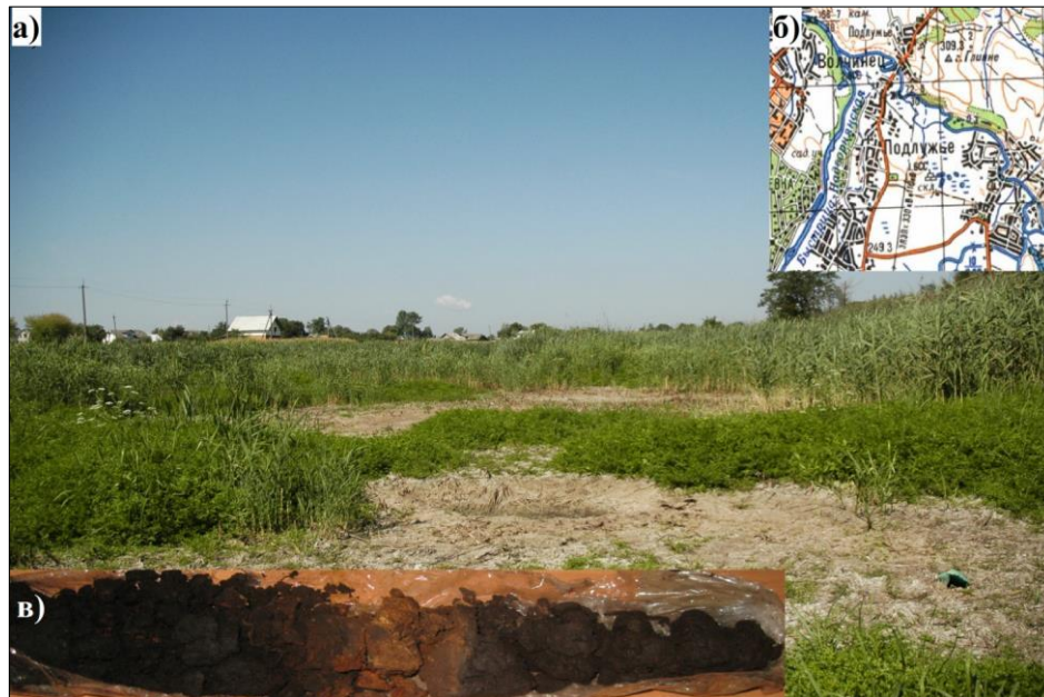
Рис. 1. Торфовище Підлузья: а – загальний вигляд; б – розташування; в – приклад керна, гл. 0,0–0,5 м (шар 0,10–0,15 м – перерва в осадоагромадженні)

Згідно з отриманими палінологічними матеріалами, у середньому дріасі (DR-2 12,2–11,8 тис. років тому), до якого за радіовуглецевим датуванням віднесено нижню частину розрізу, на Передкарпатті переважала трав'яниста рослинність (див. рис. 2). Відсотковий вміст пилку сосни свідчить, що цієї породи не було у складі рослинності околиць Підлузья. Зрідка траплялись угруповання беріз та верби. Переважання у спорово-пилковому комплексі пилку осоки засвідчує, що переважним типом рослинності були вологі луки. До складу лучної рослинності в незначній кількості входили різнотрав'я та злаки. Панування осокових угруповань та чагарників верби у середньому дріасі описано для південного сходу Польщі К. Балагою [9, 10]. Автор пов'язує перезволоження субстрату, яке виявляється у спорово-пилкових спектрах значною участю паліноморф осоки, із таненням багаторічної мерзлоти.