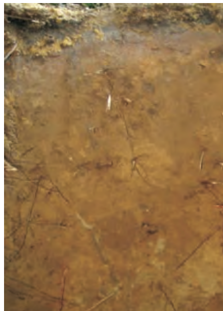
Рис. 9. Дерново-приховано-підзолистий піщаний на флювіо-гляціальних відкладах ґрунт

Fig. 10. Dark gray podzolized loamy loam on loess-like sediment soil