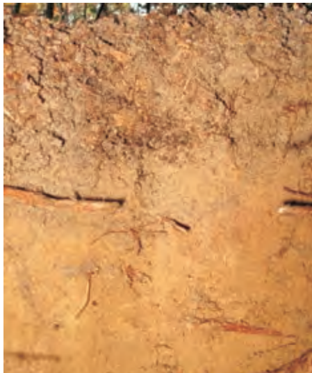
Рис. 8. Дерново-слабопідзолистий супіщаний на флювіогляціальних відкладах ґрунт

Fig. 7. Deep-weakly podzolic sandstone on fluvio-glacial sediments, soil