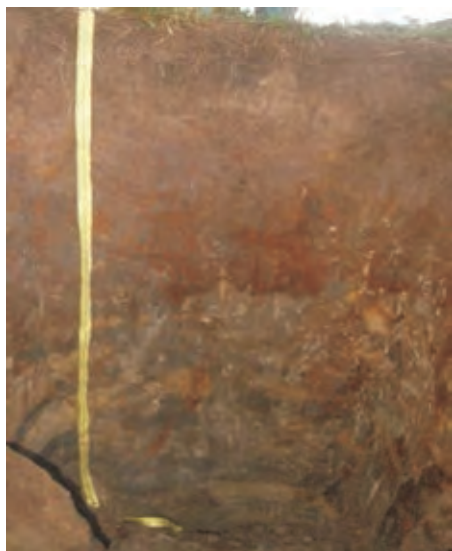
Рис. 3. Дерновий глейовий супіщаний, осушений на алювіальних відкладах ґрунт Fig. 3. Deep gleyey sandy loam, drained on alluvial deposits of soil