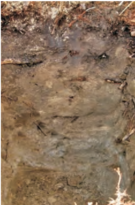
Рис. 11. Ясно-сірий лісовий опіщанений легкосуглинковий на лесоподібних суглинках дефляційний ґрунт

Eh 15–31 см. Елювіальний слабогумусований горизонт, ясно-сірий, неоднорідний, супіщаний, пластинчастий, слабоущільнений, на гранях структурних агрегатів трапляється присипка \text{SiO}_2 , поодинокі корені рослин, перехід в ілювіальний горизонт ясний. Типовий дефляційний профіль.