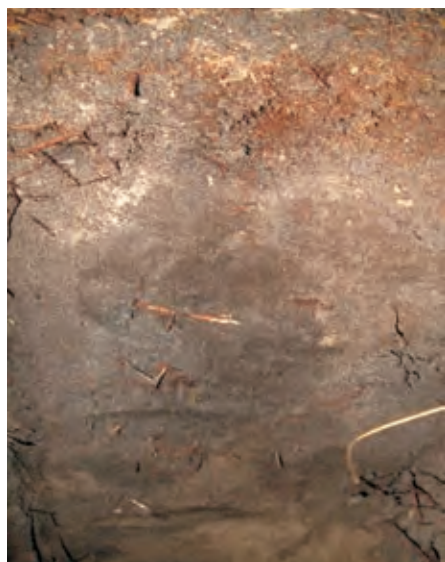
Рис. 4. Дерново-прихованопідзолистий піщаний на флювіогляціальних відкладах ґрунт