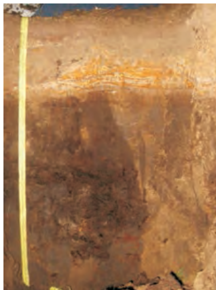
Рис. 2. Лучний глибокий глейовий піщано-середньосуглинковий на алювіальних відкладах ґрунт

У ґрунтовому профілі визначено: Pb – 10,7 мг/кг, Zn – 101, Co – 10, Cu – 6, Ni – 2,7, Mo – 8,7, Cr – 98, Mn – 350, V – 25, Ba – 240, Sr – 37, Zr – 100, Fe – 20 000, Ti – 700, Sn – 2,8 мг/кг [1].