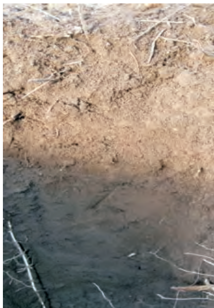
Fig. 9. Deep-hidden-podzolic sand on fluvio-glacial sediments soil