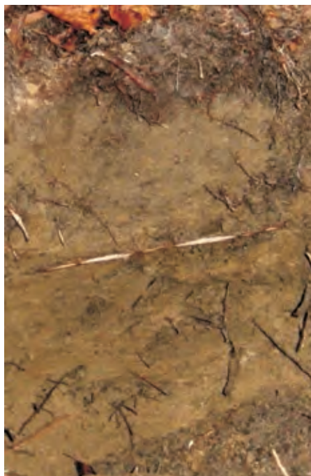
Рис. 12. Ясно-сірий лісовий легкосуглинковий на лесоподібних суглинках дефляційний ґрунт

В описаних профілях атомно-абсорбційним методом визначено 15 хімічних елементів. Валовий вміст хімічних елементів у ґрунтах, сформованих на лесових товщах, є значно вищим, ніж на флювіогляціальних відкладах. Це пов'язано зі значною гумусованістю сірих лісових ґрунтів, суглинистим гранулометричним складом,