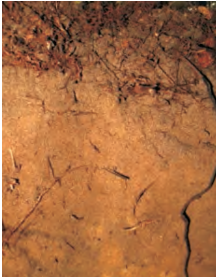
Рис. 7. Дерново-слабопідзолистий супіщаний на флювіогляціальних відкладах ґрунт

Fig. 7. Deep-weakly podzolic sandstone on fluvio-glacial sediments, soil