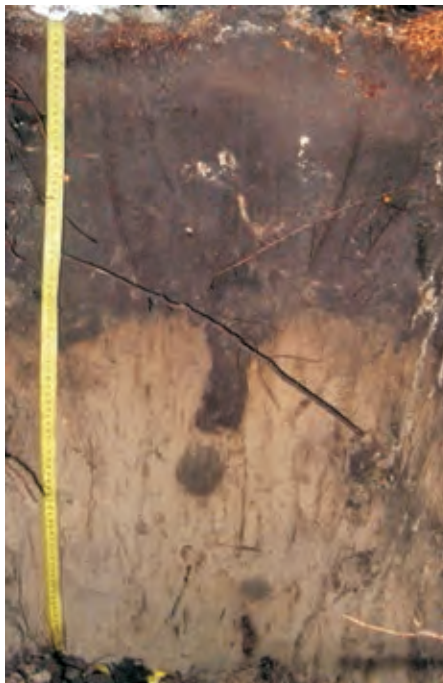
Рис. 5. Дерновий слаборозвинутий поверхнево-глеюватий піщаний на флювіогляціальних відкладах ґрунт Fig. 5. Depleted underdeveloped surface-glued sand on fluvio-glacial sediments soil

Fig. 6. Deep-weakly podzolic sandy loam on fluvio-glacial sediments soil