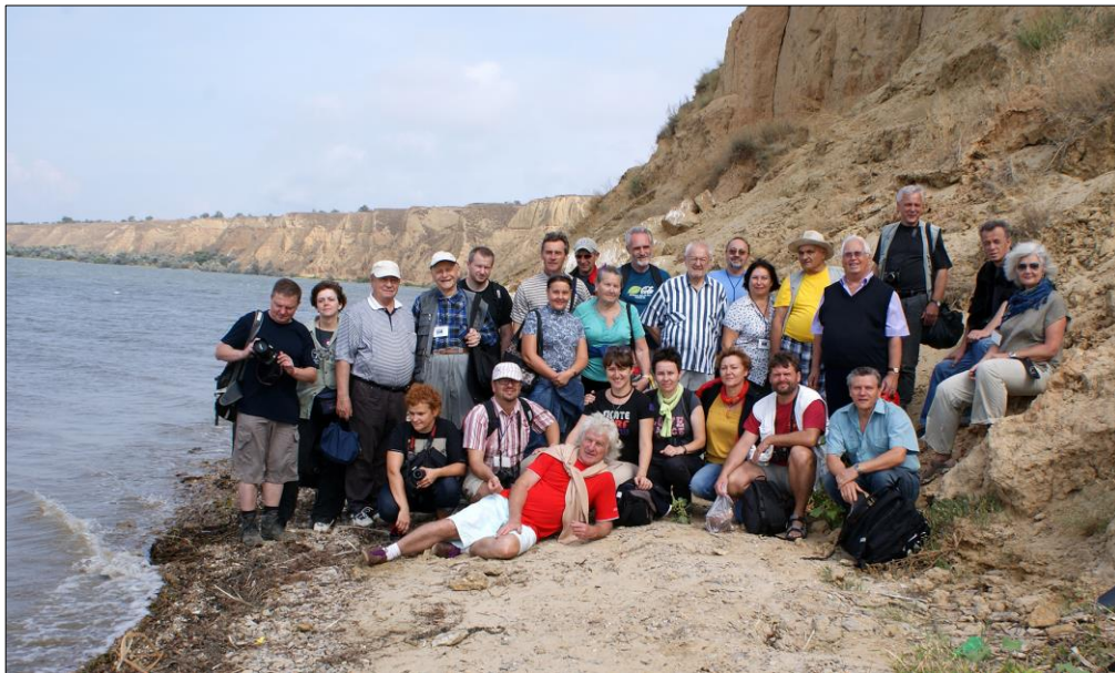
Учасники XVIII українсько-польського польового лесового семінару на розрізі плейстоценової лесово-грунтової серії Роксолани на Одещині (2013) The participants of the XVIII Ukrainian-Polish Field Loess Workshop at the section of the Pleistocene loess-soil series Roksolany in Odesa region (2013)