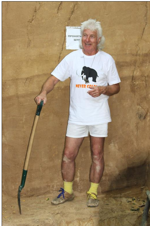
За улюбленою справою – на лесовому розрізі During a favourite activity – at the loess section