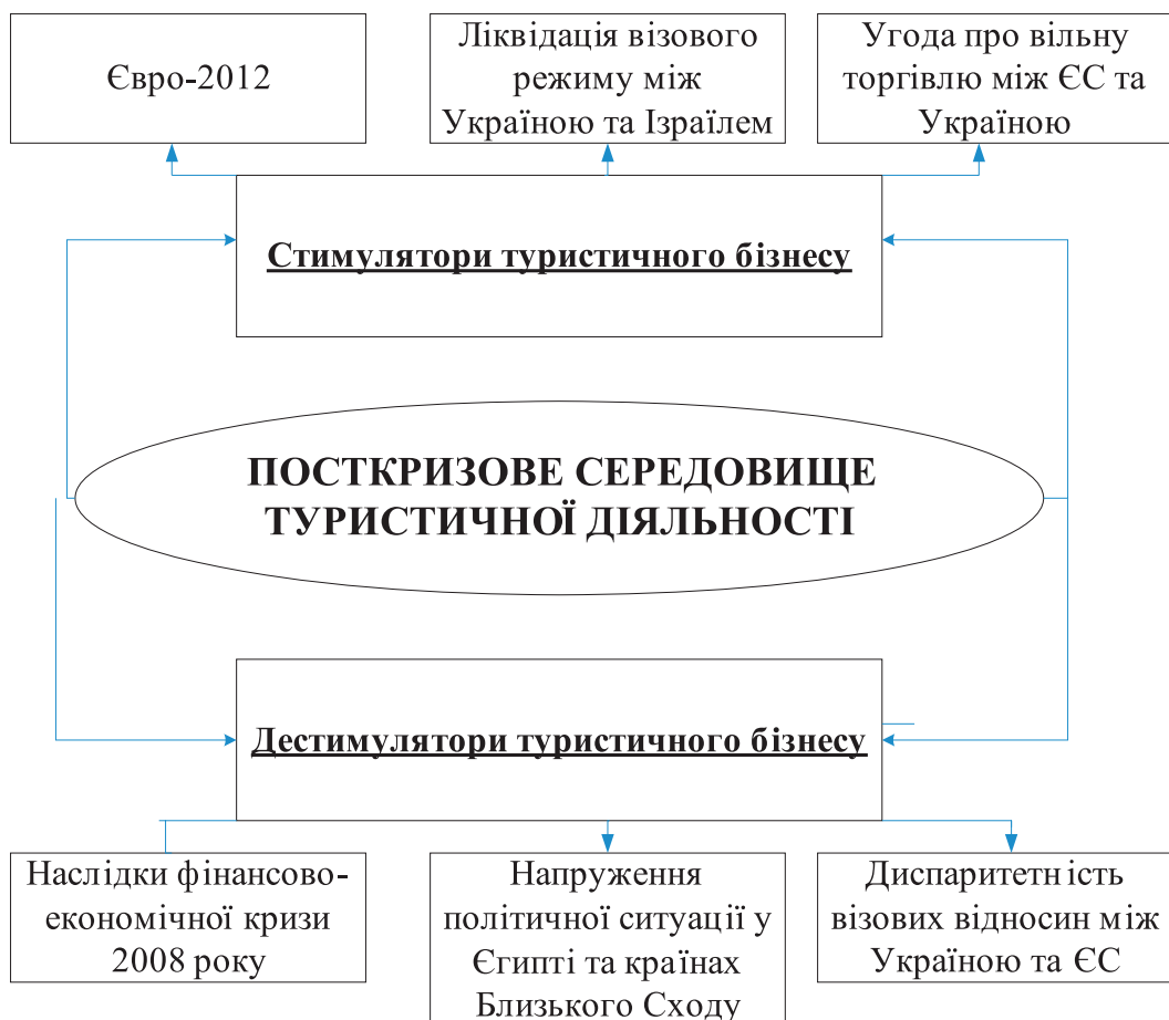
Рис.2. Чинники розвитку туристичної галузі в Україні у 2010 – 2013 рр.

Експерти прогнозують, що завдяки такому масштабному спортивному заходу, як ЧЄ, кількість туристів, які відвідають м. Львів, подвоїться [2]. За даними одного із лідерів консалтингу, американської компанії Monitor Group, перебуток від перебування одного туриста на території міста в середньому становить 411,4 дол. США. Відповідно, загальний дохід 2010 р. від усіх туристів приблизно становив 320,9 млн дол США [3]. Зважаючи на прогнозні розрахунки (подвоєння кількості туристів після 2012 р.), можна сподіватись, що загальний дохід від перебування туристів у місті перевищить 641,8 млн дол США, що складатиме 14,4% валового регіонального продукту Львівської області Отже, необхідно якнайшвидше посилити заходи з фінансування туристичного розвитку міста, адже саме від інтенсивності розбудови туристичної інфраструктури залежатиме обсяг надходжень до державного бюджету від туристичної галузі у майбутньому.