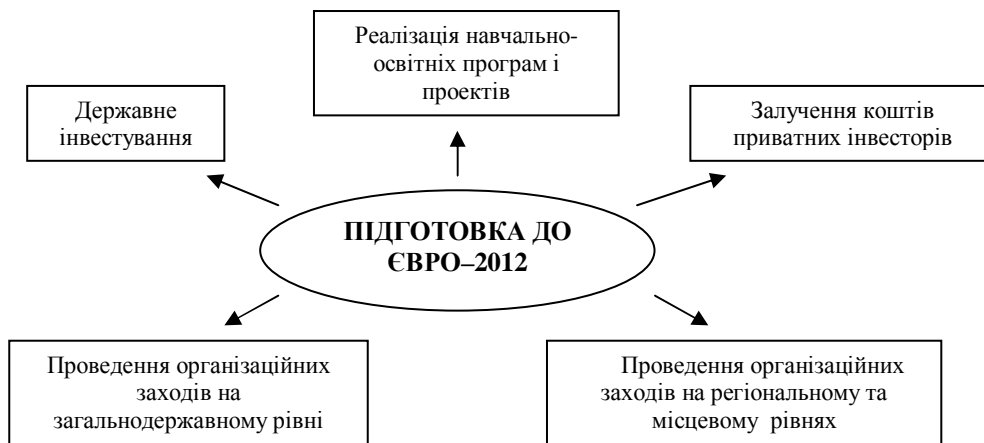
Рис. 4. Інструменти структурної модернізації економіки в процесі підготовки до Євро-2012

мовних навичок у працівників правоохоронних структур і медичних закладів, а також становлення ефективних систем адміністрування новими об'єктами інфраструктури; державне та приватне інвестування в будівництво сучасних спортивних арен, модернізацію комунального господарства, розвиток галузей сфери послуг, включаючи туристично-готельне господарство та відпочинково-розважальну індустрію; проведення організаційних заходів, спрямованих на координацію зусиль центральних і регіональних органів влади, а також узгодження пріоритетів їхньої діяльності з операційними і стратегічними планами приватних українських і закордонних інвесторів тощо (рис. 4).