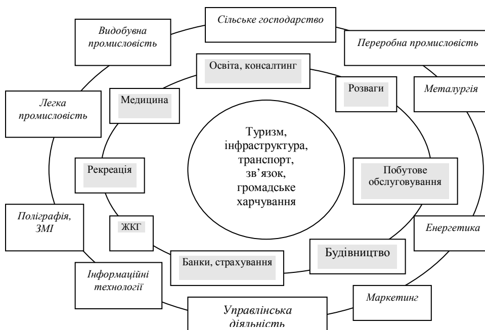
Рис. 2. Концентрація впливу Євро-2012 на різні галузі національної економіки

Загалом сила мультиплікаційного впливу Євро-2012 на українську економіку в різних секторах господарського комплексу виявлятиметься за принципом «концентричних кіл». В епіцентрі впливу опиняться туризм, об'єкти інфраструктури (насамперед спортивної), транспорт і зв'язок, сфера громадського харчування. Друге коло складатимуть будівельна галузь, навчально-освітня та консалтингова діяльність, медичне обслуговування населення, рекреаційно-відпочинкова індустрія та курортне господарство, культурно-розважальні заклади, банківські та страхові установи, житлово-комунальна сфера, сектор побутового обслуговування населення. У третє коло мультиплікаційного впливу від проведення в Україні Євро-2012 потраплять сільське господарство та переробна промисловість, металургія, галузі видобувної промисловості, інформаційна сфера, включаючи засоби масової інформації, поліграфію та сектор ІТ-технологій, легка промисловість, енергетика, а також управлінська діяльність та маркетингові послуги (рис. 2).