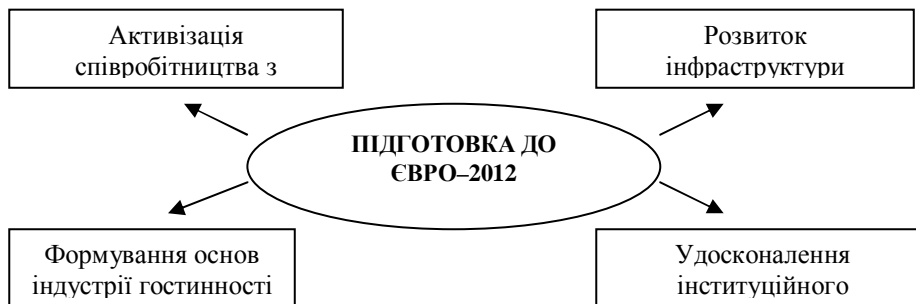
Рис. 1. Основні напрями реалізації заходів з підготовки України до Євро-2012

Першочерговими напрямками докладання зусиль у напрямі здійснення організаційних заходів, пов'язаних з підготовкою до Євро-2012, сьогодні можна вважати: активізацію співробітництва України з Польщею, УЄФА та іншими європейськими структурами, задіяними у цьому процесі; розвиток прикордонної, транспортної та комунальної інфраструктури; удосконалення інституційного середовища в контексті формування правових засад розвитку державно-приватного партнерства та поліпшення в Україні інвестиційного клімату; становлення основних елементів індустрії гостинності, таких як розвиток туристично-готельного господарства, покращення його кадрового забезпечення, реалізація заходів, спрямованих на формування сучасного іміджу України в Європі та світі тощо (рис. 1).