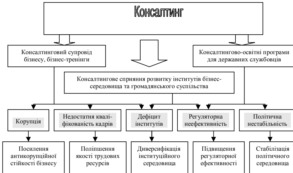
Рис. 2. Роль консалтингу в нівелюванні основних бар'єрів на шляху іноземного інвестування в Україну*

грунт елементи передових технологій, модернізованої інфраструктури, ділової репутації та бізнес-комунікацій» [1, с. 80].