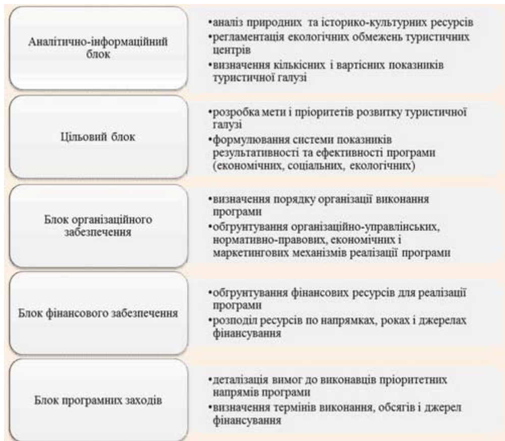
Рис. 1. Типова структура регіональних цільових програм розвитку туризму [1]

5. Створення безпечних умов для туристів.