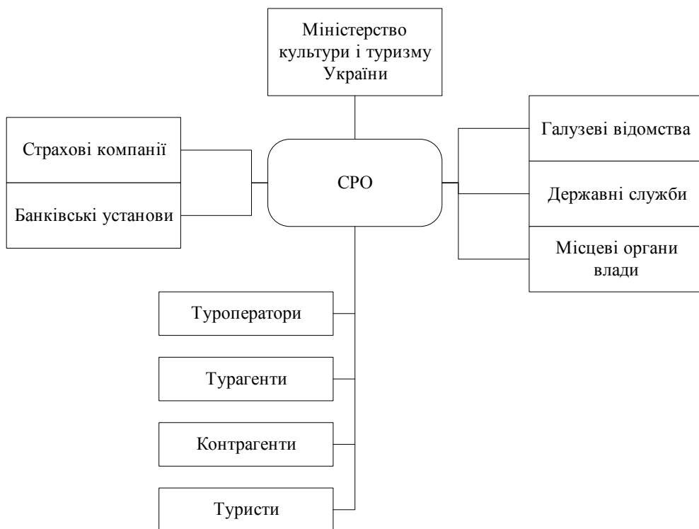
Рис. 2. Централізовано-ліберальна модель (CPO) у розрізі туристичної індустрії України (складено автором)

Отже, підприємницька діяльність у сфері туризму з усіма своїми відмінними рисами покликана стати об'єктом стратегічного управління як на державному рівні, так і у приватному секторі. Враховуючи особливості свого бізнесу, туристичні організації повинні створювати таку систему управління, яка підтримуватиме баланс між діловим середовищем, сутнісною основою організації та результатами її діяльності. Отож використання системи управління, що включає в себе методи і прийоми стратегічного управління, і створення всередині самої організації механізмів саморозвитку на базі використання концепції стратегічного управління, даватиме змогу вищому керівництву туристичних організацій приймати комплекс рішень та здійснювати дії зі стратегічного аналізу, визначення цілей, стратегічного вибору, а також з реалізації стратегічного плану в реальному масштабі часу.