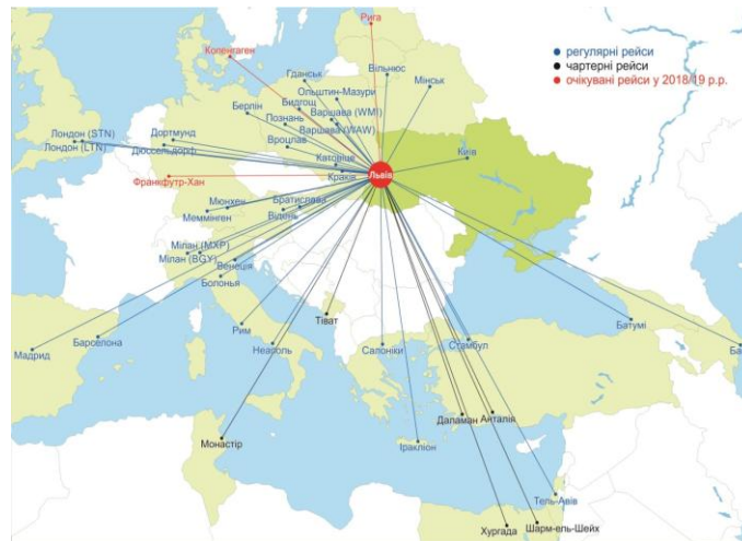
Рис.1. Карта прямих авіарейсів Львівського летовища [9]

Польські Авіалінії», «Роза Вітрів», «Люфтганза», «Аеросвіт», авіакомпанія «Віз Ейр Україна» та інші. З Львівського летовища здійснюють регулярні рейси чотири авіакомпанії: авіакомпанія Львівського авіапідприємства, Авіалінії України, Міжнародні авіалінії України. Carpatair використовуючи авіа-вузол у румунському місті Тімішуара, з'єднує Львів із більшістю італійських міст, німецькими містами Дюссельдорф, Мюнхен, Дрезден, з Венецією та грецькими Афінами і Салоніками. Німецький авіаперевізник Lufthansa – один з провідних у Європі – відкрив щоденні рейси зі Львова до Мюнхена. Мюнхен, своєю чергою, є вузловим аеропортом авіакомпанії і може забезпечити транзит пасажирів зі всього світу. Загалом зі Львова відбувається 45 міжнародних рейсів (рис.1).