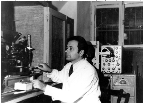
За електрофізіологічною установкою (Львів, 1978 р.)

Завдяки використанню цих методів, він встановив величину мембранного потенціалу багатьох типів секреторних клітин і його залежність від іонних градієнтів, виміряв електричний опір та ємність плазматичної мембрани, виявив електрогенний ефект натрій-калієвої помпи. Він дослідив також роль кальцію, температури та кислотності у регуляції іонної проникності плазматичної мембрани. Ним було ідентифіковано та досліджено властивості різних типів іонних каналів та натрій-кальцієвого обмінника. Електрофізіологічні дослідження поєднувалися з дослідженням секреції травних ферментів in vitro , що лягло в основу