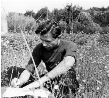
На практиці з ботаніки (село Порошково, Карпати, 1960 р.)