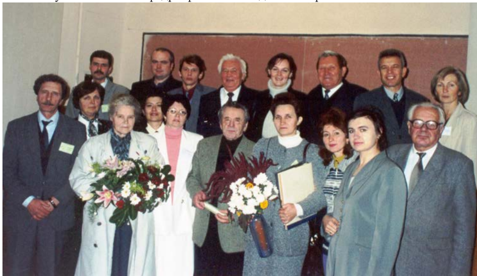
Учасники Міжнародної конференції, присвяченої пам'яті проф. Ірини Шостаковської (Львів, 2002 р.)

міжнародні наукові конференції (2002, 2004 і 2006 рр.). Їхнє проведення є свідченням визнання наукової школи кафедри фізіології людини і тварин.