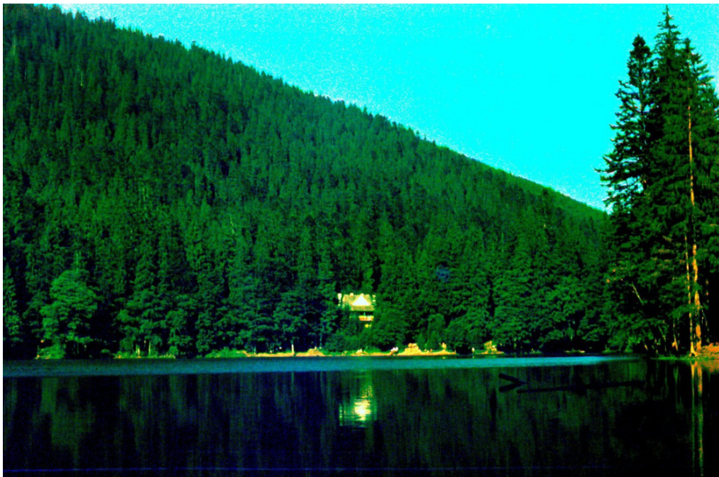
Синевирське озеро (авторське фото Мирона Клевця, 1969 р.)