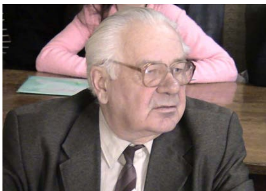
У журі конкурсу студентських наукових робіт у рамках конференції «Молодь і поступ біології» (Львів, 2007 р.)

Ще у 1984 р. опублікував підручник «Основи електрофізіології» (Київ, «Вища школа»; із співавт.) – перший і єдиний (!) україномовний підручник у цій галузі. У 2000 р. опублікував навчальний посібник «Фізіологія людини і тварин. Книга 1. Фізіологія