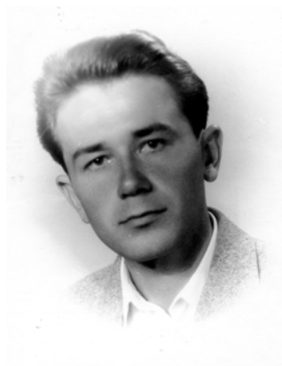
Студент 5 курсу Ужгородського університету (1963 р.)