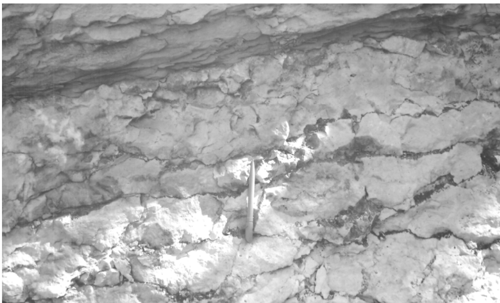
Рис. 1. Сутуро-стилолітові шви у верхньокрейдових вапняках Гірського Криму.

Відстань між стилолітами то розширюється, то звужується, переважно коливається в межах 7–20 см. Місцями вони розбили вапняки на невеликі, витягнуті вздовж простягання порід блоки. Сутуро-стилолітові шви простежені від покрівлі вапняків униз по розрізу на відстані декількох метрів. Нижче вони перекриті елювіально-делювіальними уламками порід. Стилоліти дрібно-, грубостовпчасті, місцями ямкувато-горбисті. Вздовж стовпців і на похилених поверхнях вапняків є штрихуватість, подібна до дзеркал ковзання. Поверхня стилолітів покрита тоненькою глинистою плівкою жовтувато-коричневого, іноді зеленкуватого кольору (рис. 2, a–в ).