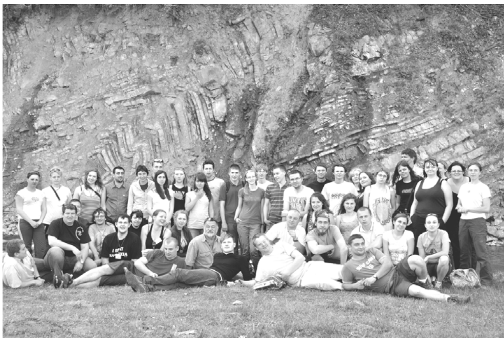
Учасники конференції на геологічній екскурсії в долині р. Сукіль

На електронну скриньку конференції надійшли численні заявки на участь від молодих учених з Польщі, Латвії, Литви, Естонії, Росії, Чехії, Болгарії, Швейцарії, Нігерії, Ірану, Індії та України. Загалом на конференції представили результати наукових досліджень понад 100 студентів та молодих науковців. Найчисленнішими були іноземні наукові делегації з Ягеллонського і Варшавського університетів (Польща) та Ризького університету (Латвія). Активну участь у конференції взяли студенти й аспіранти геологічного та географічного факультетів нашого університету. Приємно вразив високий рівень усних та стендових доповідей учасників з українських навчальних закладів та наукових установ.