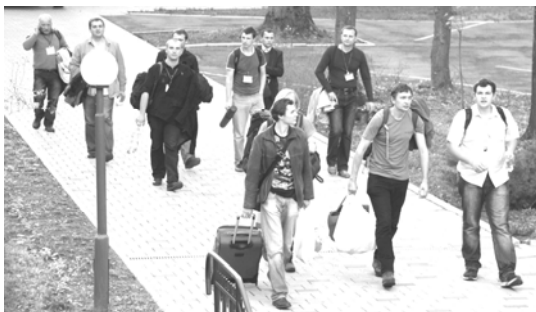
Приїзд учасників конференції в рекреаційно-відпочинковий центр Курії Львівської Архієпархії УГКЦ

З 27 по 30 квітня 2012 р. на геологічному факультеті Львівського національного університету імені Івана Франка відбулася Третя студентська міжнародна геологічна конференція (3rd Students International Geological Conference). Проведення таких щорічних міжнародних студентських геологічних конференцій започатковано геологічним товариством студентів Ягеллонського університету в Кракові, де відбулась перша конференція в квітні 2010 р. Традиційно всі учасники конференції обирають країну і навчальний заклад, де відбудеться наступна зустріч.