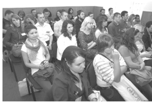
Учасники конференції під час роботи в секціях і на відпочинку

У такому форматі вже проведено три конференції. Зокрема, Перша студентська міжнародна геологічна конференція відбулася 16–19 квітня 2010 року в Кракові, Друга – у містечку Ратнекі на базі Ризького університету 28 квітня–1 травня 2011 р., де студентська спільнота ухвалила рішення доручити організацію та проведення Третьої конференції представникам геологічного факультету Львівського національного університету імені Івана Франка. Ідею проведення конференції з прихильністю прийняло керівництво геологічного факультету ЛНУ імені Івана Франка. Місцем проведення конференції органі-