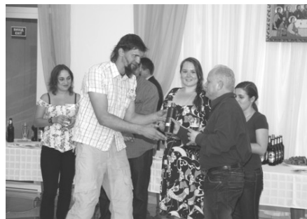
Традиційна передача естафети представниками Ризького університету організаційному комітетові конференції

На конференції студенти, аспіранти і молоді науковці з різних країн мають змогу обговорити результати наукових досліджень і побувати на найцікавіших геологічних об'єктах країни-організатора. Конференція відбувається в форматі усних та стендових доповідей по тематичних секціях. Особливість конференції у тому, що її організують студентські геологічні товариства навчальних закладів, які її приймають. Звичайно,