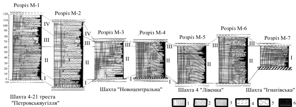
Рис. 1. Стратифікація і кореляція розрізів пласта h_7 за ліпотипним складом вугілля: 1 – вітрен; 2 – кларен; 3 – дюрено-кларен; 4 – кларено-дюрен; 5 – дюрен; 6 – фіузен.

кларену – 18. Головними вуглеутворювачами були лепідодендрони, клинолисти, каламіти, зрідка траплялись звичайна папороть і птеридосперми. Вітринізована речовина червоно-бура, великотритова і атритова, волокниста, однорідна, розщеплена, не грудкувата. Ліпідної речовини багато: мікроспори і атрит, довгі мегаспори з екзиною товстою і середньої товщини, мегаспорангії з мегаспорами, що функціонували. Характерна також наявність середньої кількості фіузенізованої речовини: лінз ксилівітreno-фіузену, мікриніту, а також мікропрошарків глинистої речовини.