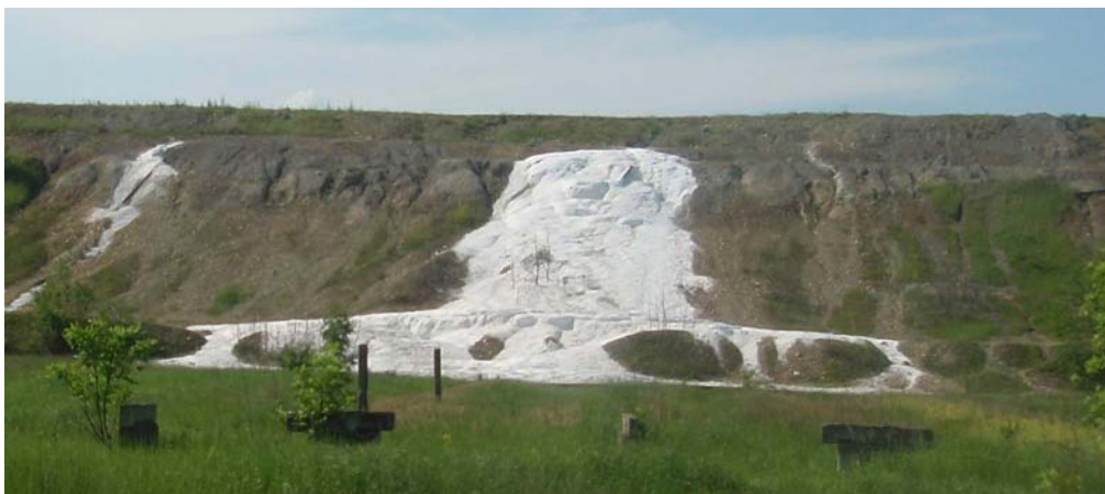
Рис. 3. Мірабіліт-тенардитові агрегати (білого кольору) на дамбі хвостосховища № 1, які маркують витoki розсолів у річкові води та четвертинний водоносний горизонт.