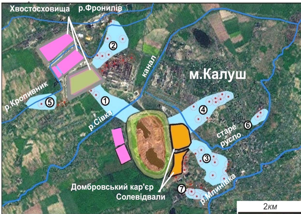
Рис. 4. Ореоли засолення підземних вод у зоні впливу Калуш-Голінського родовища (позначені цифрами).

Інші техногенні об'єкти – хвостосховища № 2 та № 3, шламонакопичувач та акумулювальні басейни – є менш потужними джерелами надходженнями засолених інфільтратів, однак їхній потенціал не можна не враховувати в ході вивчення динаміки засолення підземних та поверхневих вод. Я. Семчук на підставі гідрогеологічних спостережень виділив сім головних ореолів засолення ґрунтових вод (рис. 4) [9, 10].