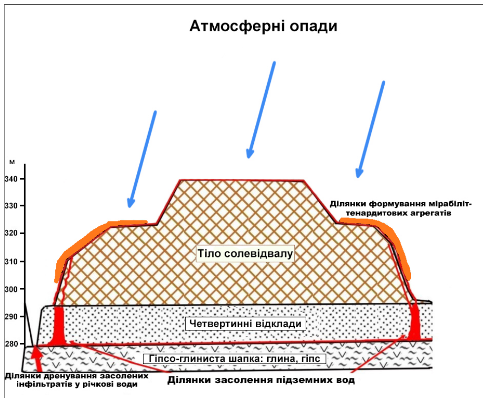
Рис. 2. Модель формування засолених інфільтратів та забруднення ними підземних і річкових вод.