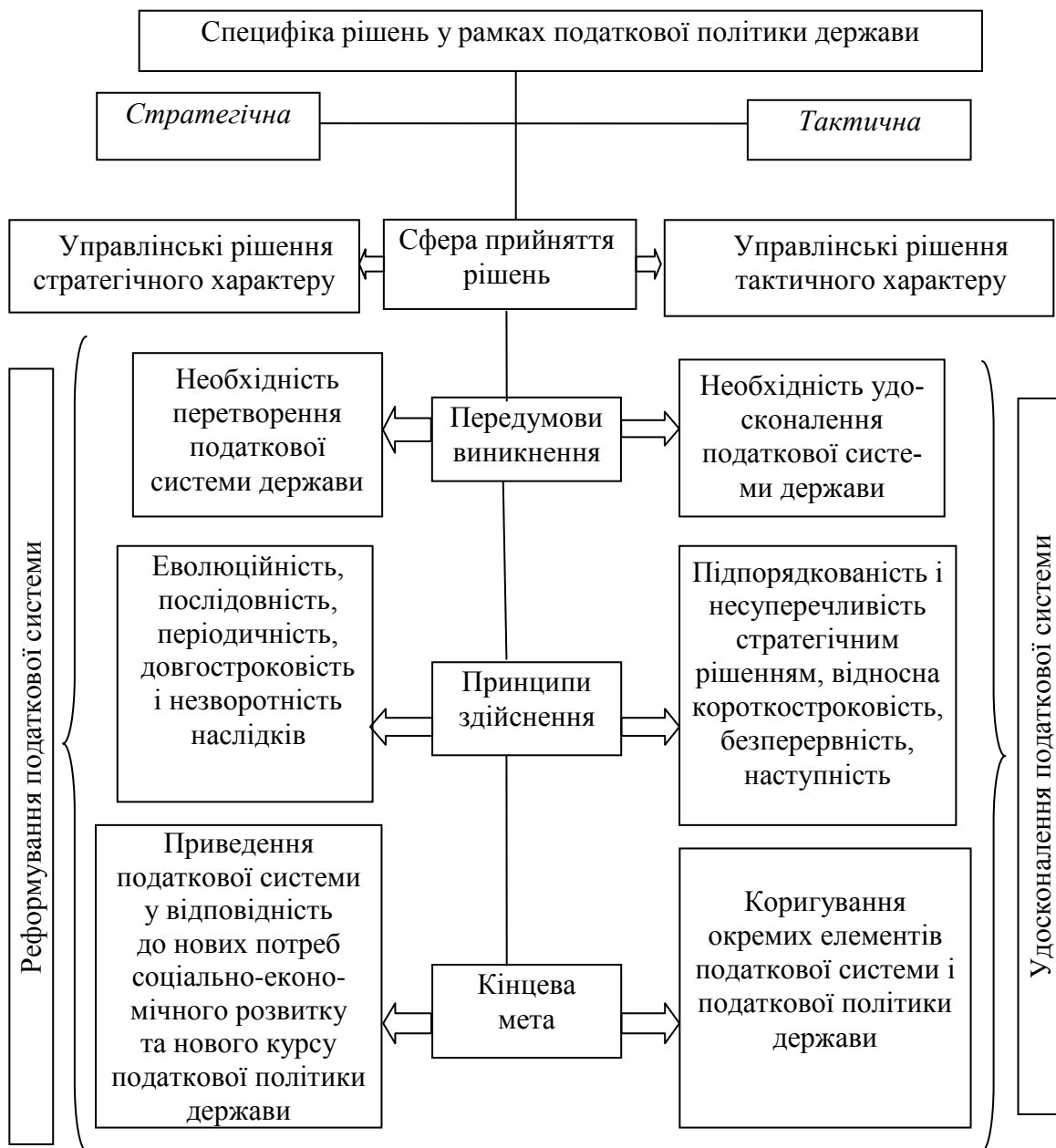
Рис. 1. Специфіка рішень у рамках стратегічної та тактичної державної податкової політики та їх вплив на податкову систему (складено за [4, с. 55])

подібних витрат слід також прогнозувати при змінах у податковій політиці, особливо стратегічного характеру. Приклад останніх перетворень, що стали наслідком політичних реформ 2014 р., чітко доводить непомірність трансакційних витрат оподаткування при такій наявній бюджетній кризі, особливо за умов масштабних, іноді непослідовних, змін, зокрема системи контролюючих органів та податкового механізму. Саме в цих рішеннях, особливо враховуючи специфіку інтеграційних процесів, лівову частку займає стратегічна складова, яка матиме вплив на досить тривалий час не тільки на бюджетну ефективність, а й на соціальну (соціальна напруга, податкова дисципліна, податкова культура тощо). Специфіку впливу стратегічної та тактичної державної податкової політики на податкову політику зображено на рис. 1.