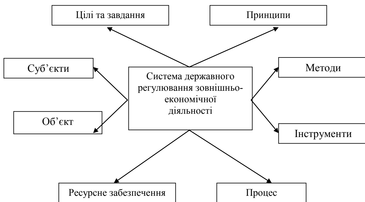
Рис. 2. Система державного регулювання зовнішньоекономічної діяльності

рних змін у вітчизняній економіці; створення сприятливих умов для інтеграції української економіки до системи поділу праці на світовому рівні та її адаптація до темпів розвитку економіки прогресивних країн; забезпечення захисту економічних інтересів суб'єктів господарювання, що приймають участь в зовнішньоекономічній діяльності; надання рівних можливостей для розвитку всіх суб'єктів зовнішньоекономічної діяльності незалежно від їх форм власності та сфер діяльності; сприяння розвитку конкуренції та усунення проявів монополізму в зовнішньоекономічній діяльності.