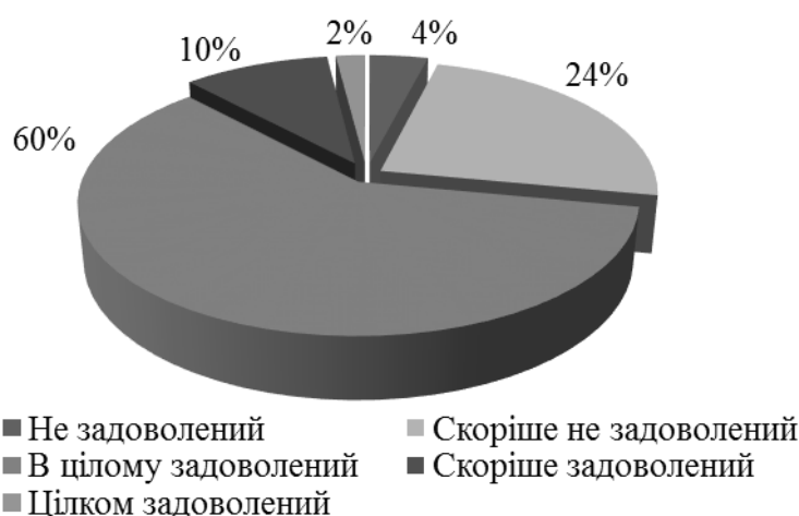
Рис. 2 – Рівень задоволення студентів якістю вищої освіти в Латвії