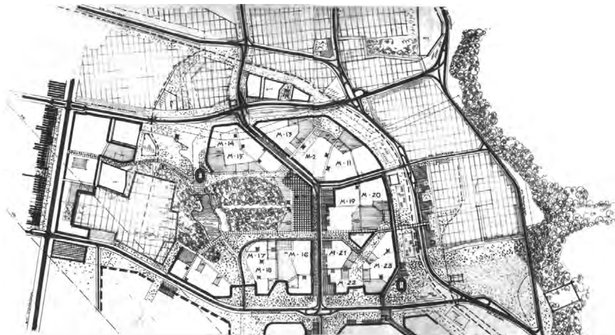
Рис. 1. Техніко-економічне обґрунтування забудови планувального району “Сихів”. М-11 – М-23 – мікрорайони планувального житлового району “Сихів”