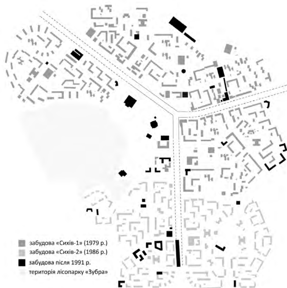
Рис. 4. Схема поетапності забудови планувального житлового району «Сихів» у 1979–2012 рр.

Сьогодні на Сихові досить великий попит на житло, останнім часом у Львові спостерігають тенденцію до переселення городян із центру міста в тихіші райони. Центр Львова перестав бути зручним для життя через масові заходи, інтенсивний рух транспорту, проблеми зберігання машин та поганий стан будинків [16].