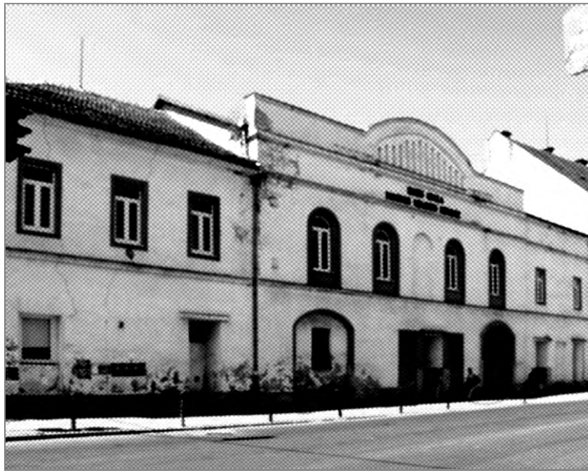
Рис. 4. Угорський театр у м. Берегово. Колишній готель “Лев”