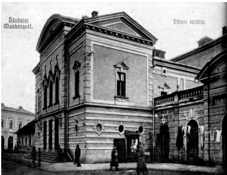
Рис. 2. Мукачівський театр, 1907 р. Сьогодні російський драматичний театр

У міжвоєнний період в театрі відбувались заходи різних національностей. В Ужгороді діяли й аматорські театральні товариства угорців (“Мозаїка”, засноване у 1920 р.), євреїв (“Габіма”), чехів і словаків. Протягом одного тільки 1933 р. на сцені театру поставлено 203 вистави; з них 97 – угорською мовою, 40 – єврейською (їдиш), 39 – чеською і словацькою, 23 українською і 4 – ромською. Тобто майже від часу заснування та будівництва театру він працював як універсальний театральний простір та виконував функції мультикультурної видовищної будівлі. Іншим цікавим прикладом є будівля, в якій сьогодні функціонує Мукачівський обласний російський драматичний театр у м. Мукачево (рис. 2). Будівництво цієї споруди розпочалось у 1896 р. і завершилось у 1899 р. Архітектором був Адольф Войта. Реалізовувала будівництво фірма Ріхарда Реслера. Глядацький зал цього театру розрахований на 500 місць. Театр побудовано за спрощеним архітектурним зразком будапештського театру “Вігсінгаз” у стилі сецесії [8] (рис. 2, 3).