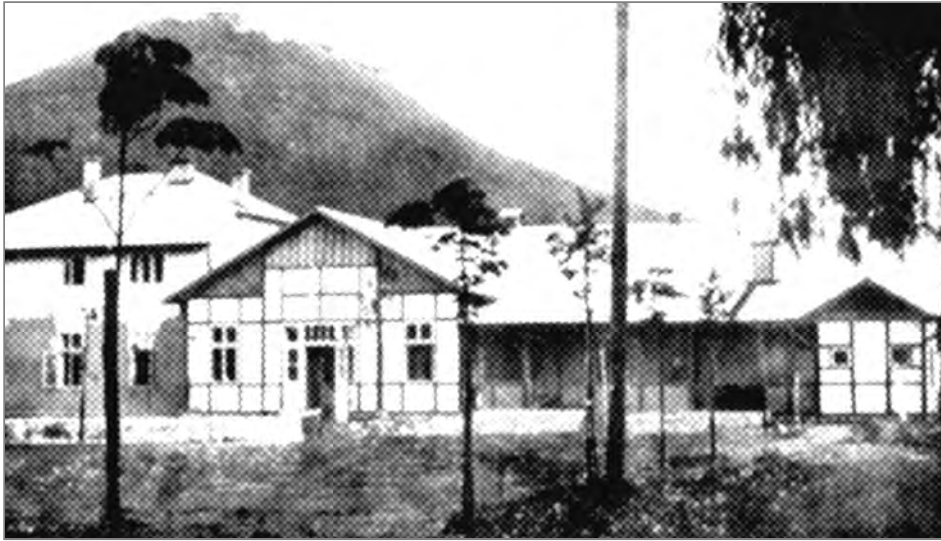
Рис. 6. Слов'янський дім у м. Хусті