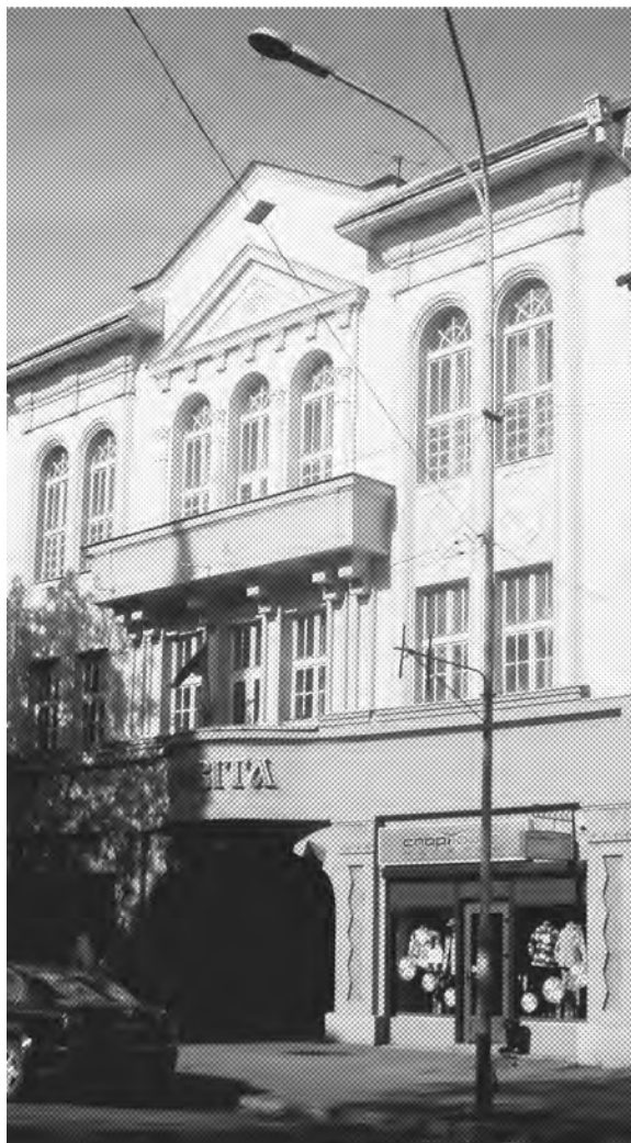
Рис. 5. Будинок “Просвіти”. Сучасний стан