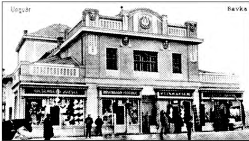
Рис. 1. Театр в Ужгороді. Листівка 20-х років XX ст. Нині ляльковий театр

У міжвоєнний період в театрі відбувались заходи різних національностей. В Ужгороді діяли й аматорські театральні товариства угорців (“Мозаїка”, засноване у 1920 р.), євреїв (“Габіма”), чехів і словаків. Протягом одного тільки 1933 р. на сцені театру поставлено 203 вистави; з них 97 – угорською мовою, 40 – єврейською (їдиш), 39 – чеською і словацькою, 23 українською і 4 – ромською. Тобто майже від часу заснування та будівництва театру він працював як універсальний театральний простір та виконував функції мультикультурної видовищної будівлі. Іншим цікавим прикладом є будівля, в якій сьогодні функціонує Мукачівський обласний російський драматичний театр у м. Мукачево (рис. 2). Будівництво цієї споруди розпочалось у 1896 р. і завершилось у 1899 р. Архітектором був Адольф Войта. Реалізовувала будівництво фірма Ріхарда Реслера. Глядацький зал цього театру розрахований на 500 місць. Театр побудовано за спрощеним архітектурним зразком будапештського театру “Вігсінгаз” у стилі сецесії [8] (рис. 2, 3).