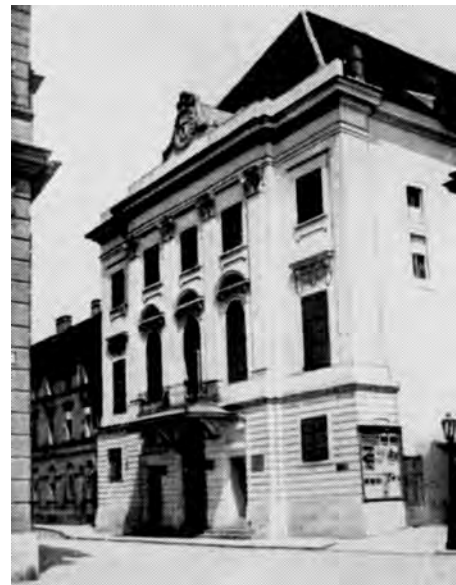
Рис. 3. Театр “Вігсінгаз”. Будапешт

Цікавим є розвиток театральної архітектури у м. Берегово, де угорське населення переважає українське. Істотний угорський вплив відчувався завжди, помітний і сьогодні. Угорці України – одна з етнічних спільнот, які міцно укорінилися на Закарпатті. Двоповерхова будівля готелю, що колись називався “Лев” (Oroszlán), розміщена на перехресті площі Героїв та Мукачівської вулиці (рис. 4). Сьогодні тут Угорський національний театр, а раніше був готель, побудований в кінці XVII ст.