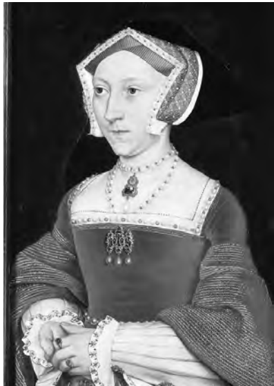
Рис. 8. Портрет Джейн Сеймур, жінка Генриха VIII. Ганс Гольбен Молодший, 1536 р.

ветинську. Звертає на себе увагу в тюдорівській моді головний убір – туре, чепець своєрідної форми: п'ятикутний з переду і накладною вуаллю ззаду. Сукні мали характерний крій рукавів з розширеними до низу відкидними крильцями та підставними манжетами до ліктя; з'являються характерні стоячі комірці – рафи (рис. 8). Елизаветинська мода інтерпретує тюдорівський образ плаття: рафи стають вищими, спідниця не просто пишна, а ще і вбрана на кринолін (рис. 9).