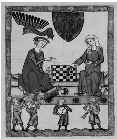
Рис. 1. Сторінка з Манесьського кодексу на якій зображений Маркграф Отто IV фон Бранденбург