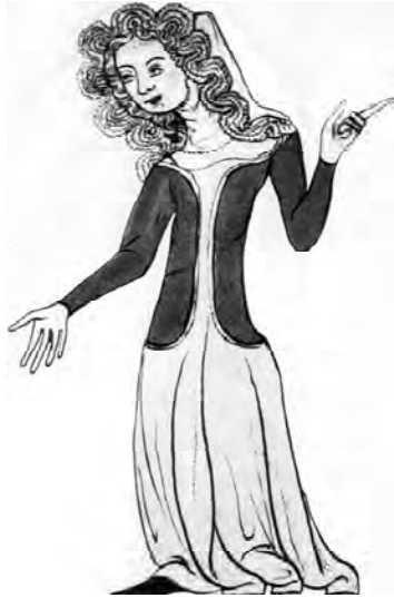
Рис. 3. Молода дівчина. Іл. з Біблії Веліслава, близько 1340 р. Державна бібліотека, Прага

накладного волосся яскраво-жовтого кольору, чим і досягали потрібного ефекту. Італійська світська архітектура Ренесансу враховувала цей момент під час будівництва лоджій у будинках. Передбачались такі зручні місця, де можна було висвітлювати волосся природно – за допомогою сонця. Для цієї цілі жінки використовували спеціальні шляпи, які називали солана (solana), які захищали лице від сонця і одночасно сприяли вибілюванню волосся, яке клали на поля цієї шляпи [4].