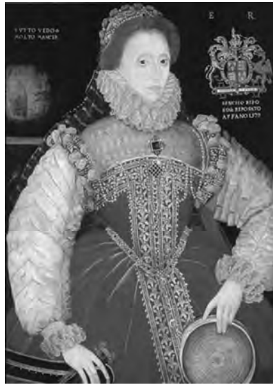
Рис. 9. Портрет Єлизавети з сітом. Джордж Говер, 1579 р.

Франція, яка географічно знаходилася на перетині торговельних шляхів із заходу на схід і з півночі на південь, у свою ренесансну моду долучила елементи з різних костюмів, утворивши зовсім своєрідне плаття (рис. 10).