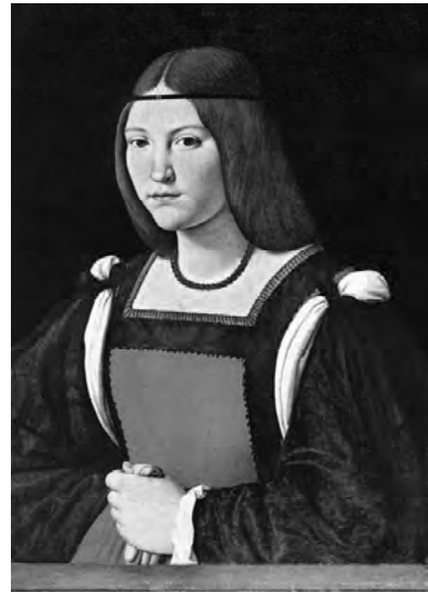
Рис. 5. Портрет молодої жінки Джованні Антоніо Болтраффіо, близько 1490 р., полотно, олія Мілан, Кастелло Сфорцеско

Гримування обличчя було мистецтвом, яким володіла кожна жінка. У волосся вплітали нитки з перлів і коралів, волосся прикрашали спеціальними сіточками і накидками. Всі модні вимоги точно виконувались і кожний італійський портрет епохи Ренесансу є тому підтвердженням.