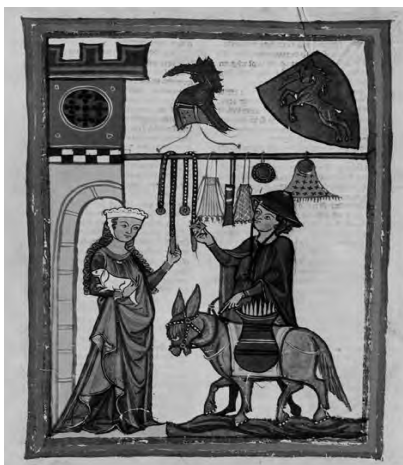
Рис. 2. Сторінка з Манесьського кодексу, на якій зображений дитман фон Аст

убрань одне на одне. Зазвичай це був спідній сорочкоподібний одяг з вузькими рукавами, який називався “каміза”. Поверх камізи вбирали нижню сукню – “котту”, а на неї верхню одягу “блію” подібного крою, але з ширшими рукавами – “духами”, або “сюрко” – сукню без рукавів, що в перекладі з французької означає “поверх котти”. Одяг осіб, які належали до вищих прошарків суспільства, шили з дорогих тканин, краї котрих обробляли декоративною облямівкою. Цю облямівку не тільки вишивали, а й прикрашали золотими пластинками і коштовним камінням. Кольори котти та блію у дворян і міщан мали бути контрастними, а також мати символічне значення [1]. Найяскравіше мода XII–XIII ст. була проілюстрована в книжковій мініатюрі і отримала назву “мода Манесьського кодексу” (рис. 1, 2). 1