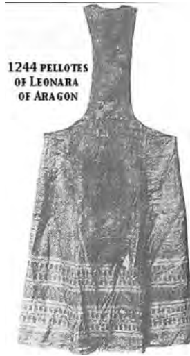
Рис. 4. Сюрко без боків (пелотес) Елеонори Арагонської (XIII ст.)