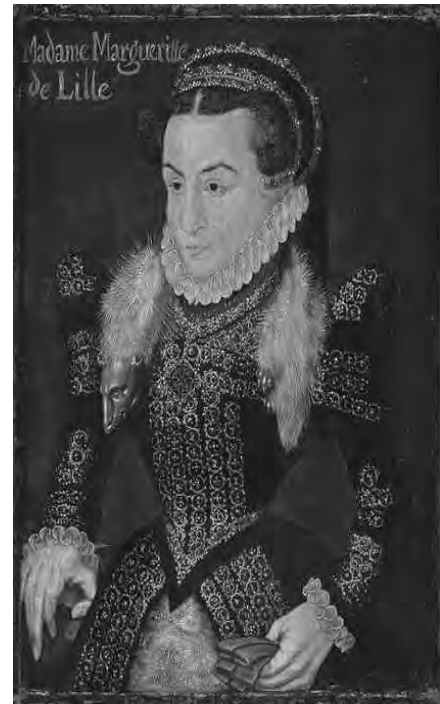
Рис. 10. Маргарита де Лілля

1 – гумовий накат на підошві; 2 – сучасний ватин у амортизуючих прокладках обладунків; 3 – пластикова пахова раковина під час проведення спортивних змагань з певними вимогами безпеки; 4 – синтетичний шнур чи нитки, нержавіючий дріт під час оперативного ремонту спорядження; 5 – використання сучасних антикорозійних і очищувальних засобів, за умов неможливості їх візуальної фіксації; 6 – використання сучасних клеючих і фарбуючих засобів за умови їх прихованого застосування (крім спеціально обумовлених випадків, дозволеного використання стилізованих предметів); 7 – використання сучасних (природних) каліброваних ниток за умови їх прихованого застосування; 8 – застосування спеціальних застілок і супінаторів для взуття, а також бандажів і пов'язок за медичними показаннями. Матеріали, які використані під час відновлення комплексу,