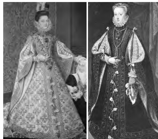
Рис. 6. Портрет Анни Австрійської, четвертої жінки Філіппа II

Англійську ренесансну моду можна умовно поділити на два періоди: тюдорівську та еліза-