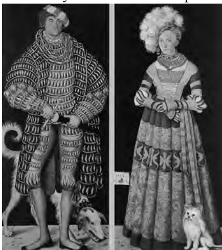
Рис. 7. Портрет герцога Генріха та його дружини. Лукас Кранах Старший. 1514 р.

Історично-музичні фестивалі, які відбуваються сьогодні під стінами замків чи на історично сформованих територіях міст, збирають велику кількість глядачів, також і завдяки відтворенню кожним учасником такого фестивалю історично правильного костюма вибраного періоду. Саме для популяризації культурної спадщини її фізичного збереження та забезпечення повноцінного життя архітектурній спадщині необхідні ґрунтовні наукові дослідження і рекомендації.