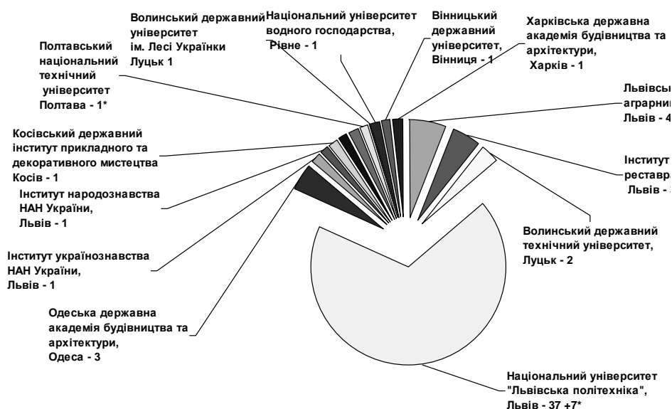
Рис. 2. Вклад спеціалізованої вченої ради К. 35.052.11 у розвиток наукових кадрів установ України упродовж 1998–2012 років:

Всього: за спеціальністю 18.00.01 – Теорія архітектури, реставрація пам'яток архітектури – 56 здобувачів за спеціальністю 18.00.02* – Архітектура будівель та споруд – 8 здобувачів