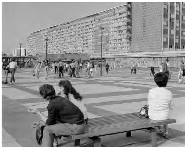
Рис. 5. Празький ряд і готель "Нева" 1973 р.

Альтмаркт і головним вокзалом, тепер (повинна була постати повністю в новому образі). Більш ніж просто широкомасштабні простори виникли в результаті початку будівництва в 1965 р. Я ще пам'ятаю, коли я переходив цю вулицю дитиною, наскільки неймовірно широкою, десь кілометр завширшки, вона мені здавалася. Сьогодні ці широкі простори можна тільки частково розпізнати, оскільки в кінці 90-х років вони були по-новому оформлені, пішохідні зони були частково звужені і тим самим було створено нову ритмічну послідовність. Звертає увагу 270 метрів завдовжки і 12 поверхів заввишки житловий будинок, названий Празьким Рядом (Prager Zeile) – тоді це був найбільший житловий будинок в НДР. У 2007 р. його реконструювало дрезденське архітектурне бюро Kneger & Lang, архітектори переформили фасад згідно із сучасними тенденціями і перепланували цей будинок на 560 квартир з різним плануванням. В кінці вулиці Прагер я доходжу до реконструйованого Норманом Фостером головного залізничного вокзалу, тут я сідаю на трамвай в напрямку Горбітц. Дорогою туди я проїжджаю повз побудований Тхобаном Фосом світовий торговельний центр. Трамвай їде деякий час багатолюдною вулицею Кессельсдорф, яка поступово підіймається вгору. Праворуч і ліворуч знаходяться різноманітні торговельні лавки і великі ринки, які є основою міського району Льюбгау.