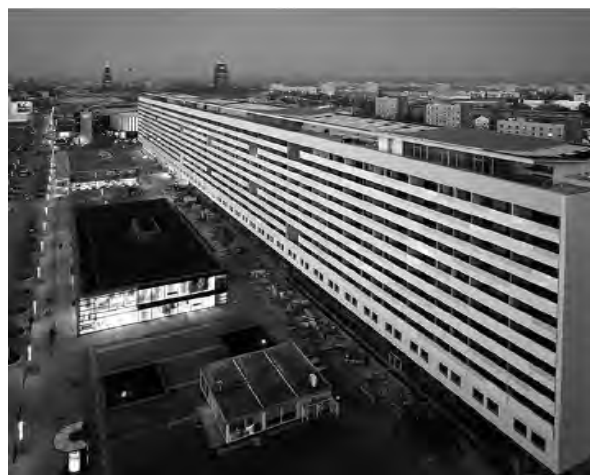
Рис. 6. Празький ряд після реконструкції у 2007 р.

За цим районом починається Горбітц – найбільше житлове поселення післявоєнного Дрездена. Цей міський район знаходиться на схилі західної околиці міста, тому він завжди піддавався критиці за те, що не був запланований в зоні чистого повітря. В часи НДР створювалися панельні житлові райони у зв'язку з використанням нового планування за сучасними стандартами, що мало велику підтримку з боку населення. Цей новий житловий мікрорайон панельної конструкції, що виник впродовж 1980 – 1989 рр., був запроєктований для 45 000 жителів і повинен був стати останнім великим поселенням Дрездена. Після переломного кризового періоду, на початку 90-х років, керівництво міста повинно було боротися зі зменшенням населення і змушено було констатувати зростаючу незаселеність Горбітца. Панельні будинки стали непривабливими, що можна сказати і про інші житлові райони Дрездена, незалежно від того, чи вони були в хорошому чи поганому стані. Хорошим прикладом реконструкції панельних будинків є невеличке поселення на північно-західній околиці Горбітца. За результатами конкурсу типові будівлі соціалістичного житлового будівництва з 2002 до 2004 рр. було переплановано на індивідуальні квартири завдяки демонтажу окремих панельних конструкцій. При цьому кількість квартир зменшилась з 829 до 270. Ці будинки було доповнено терасами, новими балконами і садами для приватного користування. Зелені зони було по-новому оформлено, внаслідок чого було досягнуто нової якості проживання.