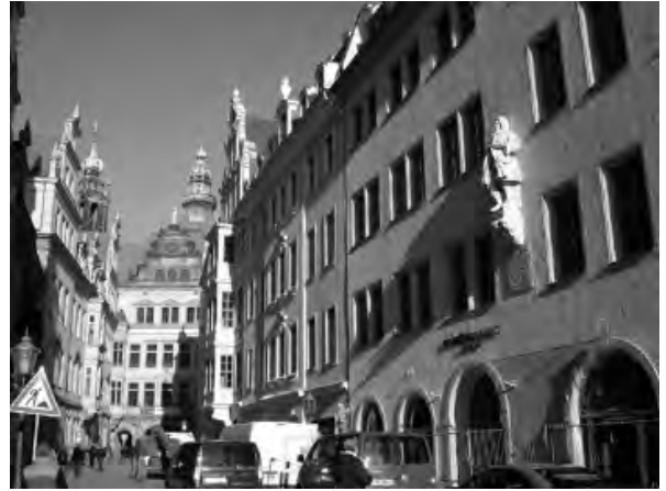
Рис. 10. Вид з вулиці Шльос на Георгентор

Переходячи Аугустівський міст з видом на бароковий ансамбль старого міста (Шльос, Хофкірхе, Земперопер і Георгентор), що завжди мені приносить багато задоволення, я майже закінчую мою прогулянку. Йдучи вулицею Шльос, я на мить зупиняю свій погляд на вигнутому скляному даху Пітера Кулька, що накриває внутрішній двір Шльосу. Цей нещодавно побудований за історичними планами квартал VIII знову творить з Георгентор добре сформований міський простір, що, на мою думку, майже нагадує велику кімнату. Таких місць зі схожою атмосферою до Другої Світової війни було декілька. “Наскільки ж вдало це було?”, запитую я себе знову і знову. З поворотом наліво в Шпорергасе я врешті-решт доходжу знову до Ноймаркт – початкової точки моєї прогулянки по місту.