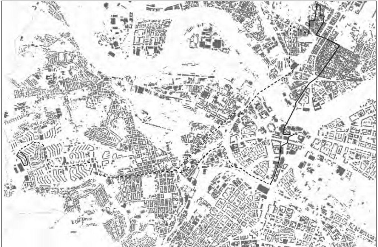
Рис. 2. Генплан Дрездена із маршрутами прогулянки містом (суцільна лінія) і поїздки на трамваї (штрихова лінія)