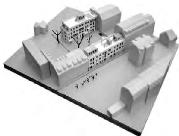
Рис. 8. Будинки на вулиці Зайтен, макет

Я їду тепер в південному напрямку, переходжу велике дорожнє кільце площі Альберта і прямую вулицею Хаупт в центральному районі Нойштадт. Південний кінець вулиці Хаупт завершує Нойштедтер Маркт із “Золотим Вершником” – пам’ятник на честь Аугуста д. Штаркен (курфюрст Саксонії і король Польщі). В кінці 70-х років площу Нойштедтер Маркт зі своїми типовими житловими будинками було по-новому оформлено, “найгарніші пішохідні зони НДР” засаджено платанами і клумбами, облаштовано лавками. По обидва боки вулиці побудовано п’ятиповерхові житлові будинки з невеликою кількістю ексклюзивних магазинів та ресторанів на першому поверсі. Довгі ряди будинків з одного боку посилюють ефект перспективи вулиці Хаупт, що звужувалась на північ, а з іншого – відмежовує квартали, що знаходяться за ними, від громадського простору цієї пішохідної зони. Декілька років тому декілька будинків, що розташовувалися в західній частині вулиці, було частково демонтовано. Тобто вулицю Хаїнріх знову було додано до цієї сітки відкритих просторів. На початку нового тисячоліття на площі Нойштедтер Маркт панельні будівлі також реконструювало архітектурне бюро Kperer & Lang. Було змінено фасади, і завдяки різноманітній архітектурі, кольору і матеріалу тут тепер також впізнається колишня парцельна структура міста. Комерційне використання перших поверхів збереглося, тому вулиця Хаупт і сьогодні залишається найулюбленішим місцем прогулянок.