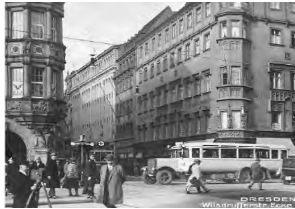
Рис. 4. Вулиця Вільсдруфер у 1930 р., фото зі старої листівки

На шляху з Ноймаркт я проходжу повз Палац культури – ще один містобудівний елемент соціалістичного міста, який замикає Альтмаркт на півночі. Сьогодні інтер'єри цієї (відносно пропорцій Дрездена) монументальної споруди перепланувало німецьке архітектурне бюро Gerkan, Marg & Partner (gmp) проти волі недавно померлого дрезденського архітектора Вольфганга Хентша, який до останнього подавав до суду. Я переходжу широку вулицю Вільсдруфер у напрямку Альтмаркт. У часи НДР ця історично торговельна вулиця перетворилась на бульвар (проспект), була спрямлена і виконувала функції східно-західної магістралі. Зараз ніщо не нагадує про колишню вузьку вулицю.