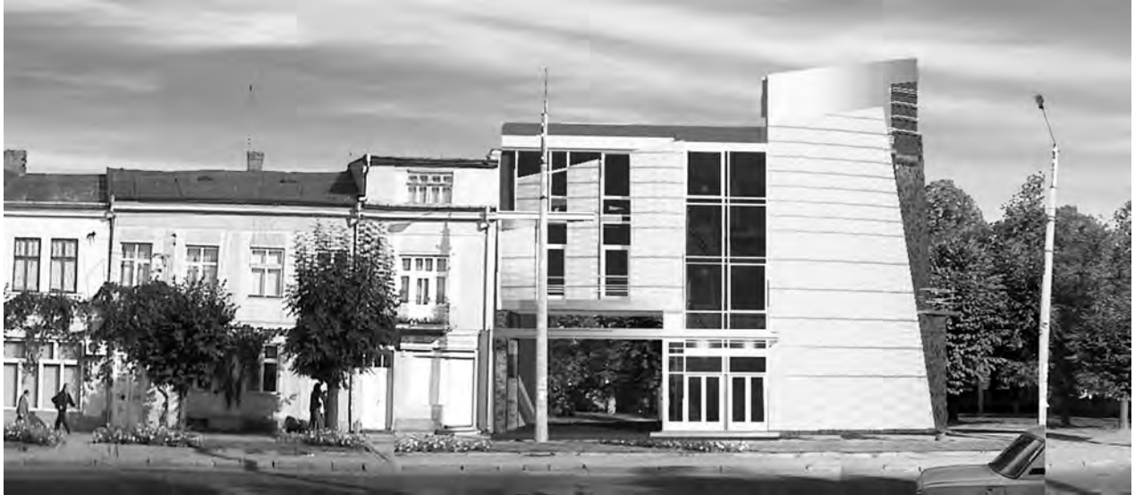
Рис. 1. Розгортка на вул. Червоноармійській

Головне архітектурне завдання полягало у створенні гармонійного поєднання різнохарактерних фасадів, різнопланових вулиць. Це завдання можна виконати, використовуючи універсальний інструментарій – алгоритм пропорціонування, оснований на принципі побудови золотого перетину. Цей алгоритм побудований на основі розробок проф. І.П. Шмельова, який дещо вдосконалив метод побудови конструктивної схеми (КС) і Модулора Ле Корбюзьє.