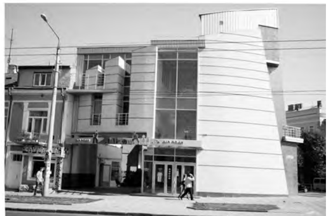
Рис. 2. Торговий центр “Дитячий світ” на розі вул. Червоноармійської та Садової