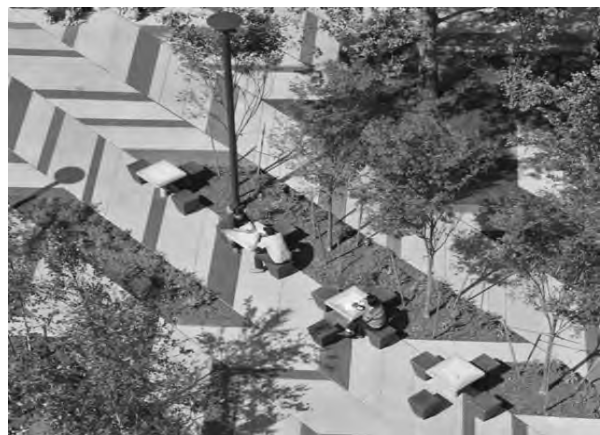
Рис. 3. Площа Levinson Plaza, Mission Park, Бостон (штат Массачусетс, США). Авт. студія “Mikyoung Kim Design”, 2008 р. Загальний вигляд