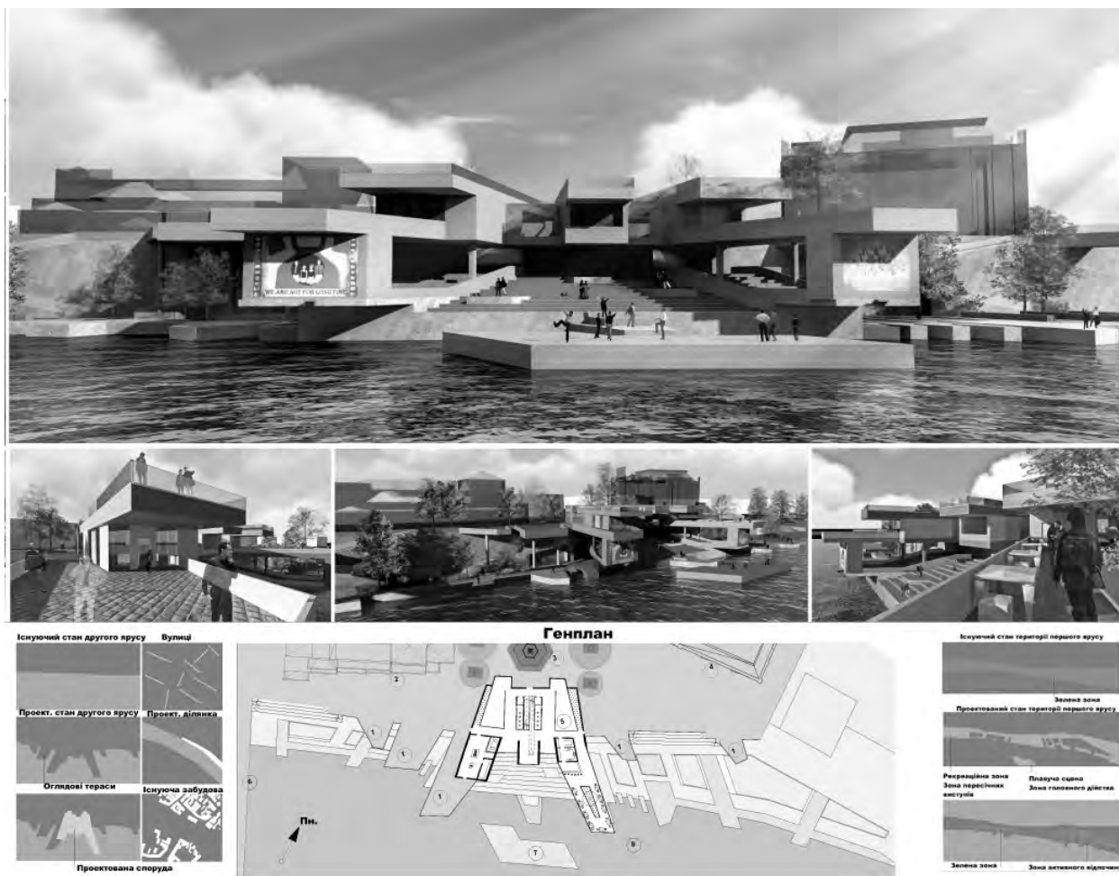
Рис. 2. Фрагмент дипломного проекту на тему “Дизайн і аранжування просторів, середовища, ландшафту у м. Ужгород для видовищно-розважальних заходів”, виконаного у 2013 р. студентом Р.Р. Свистовичем. Керівники проф. В.І. Проскураков та асист. А.М. Хір

на березі річки. Так утворено культурний осередок міста Ужгорода, в якому проєктована споруда вдало доповнює вже існуючі об'єкти, оскільки на цій території та в місті загалом мало просторів для видовищно-розважальних заходів (рис. 2).