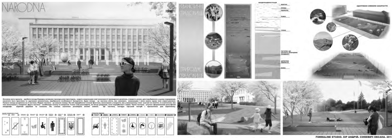
Рис. 5. Фрагмент конкурсного проекту організації площі Народна в м.Ужгороді. Автори проекту А. Хір, О. Сінкевич