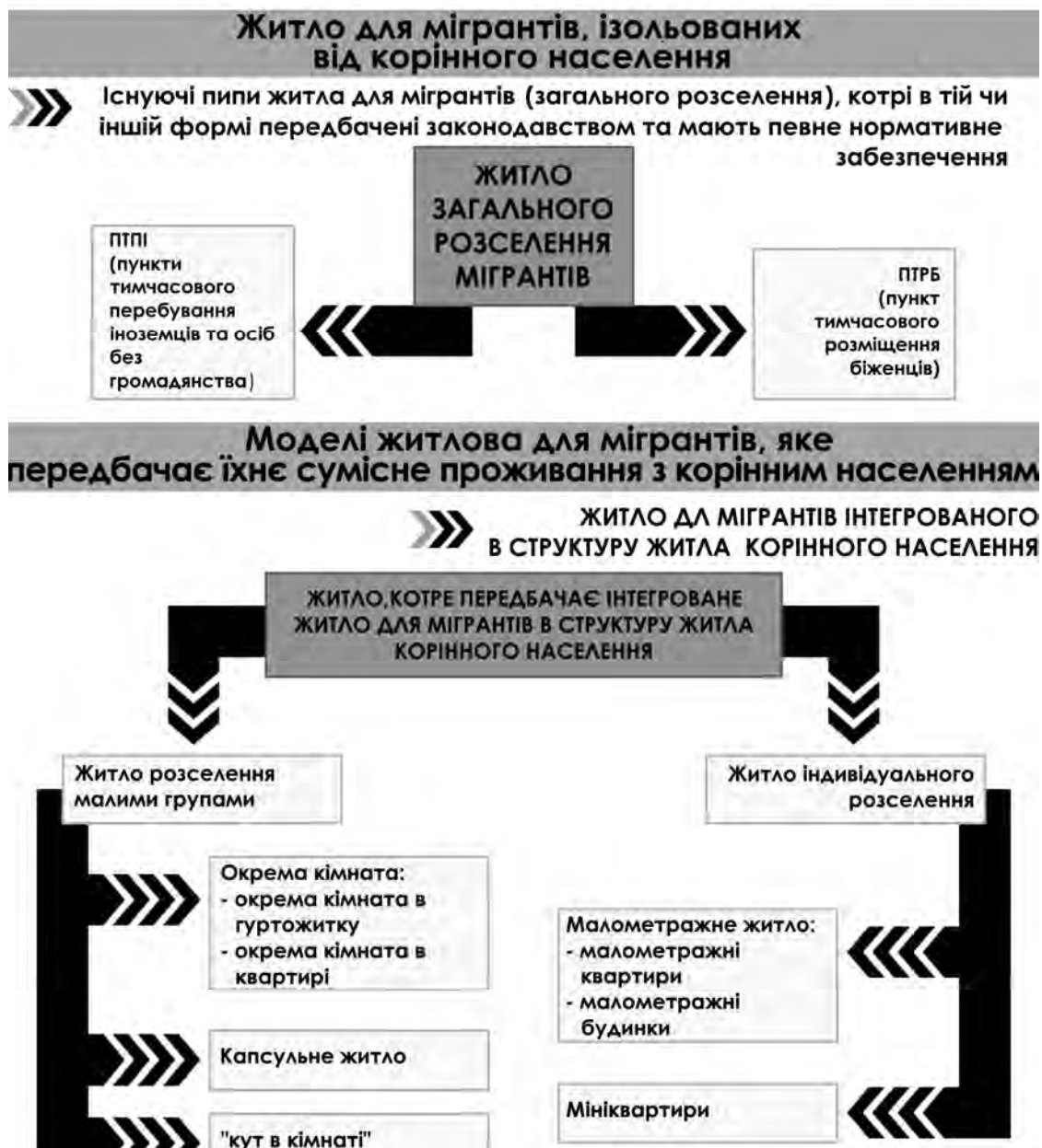
Рис. 2. Моделі взаємодії житла для мігрантів та житлового фонду громадян, корінного населення

Проблемам якісної інтеграції мігрантів в нове суспільство приділяють мало уваги, не розкривається потенціал інтеграції мігрантів через житло. Малоосвітленою залишається тема локалізації житла для мігрантів у структурі міста та її зв'язок із рівнем інтеграції в соціум та культуру приймаючого суспільства. Поза увагою багатьох досліджень залишається можливість застосування квартир малих площ, міні-квартир, квартир покімнатного заселення, житлових одиниць капсульного типу.