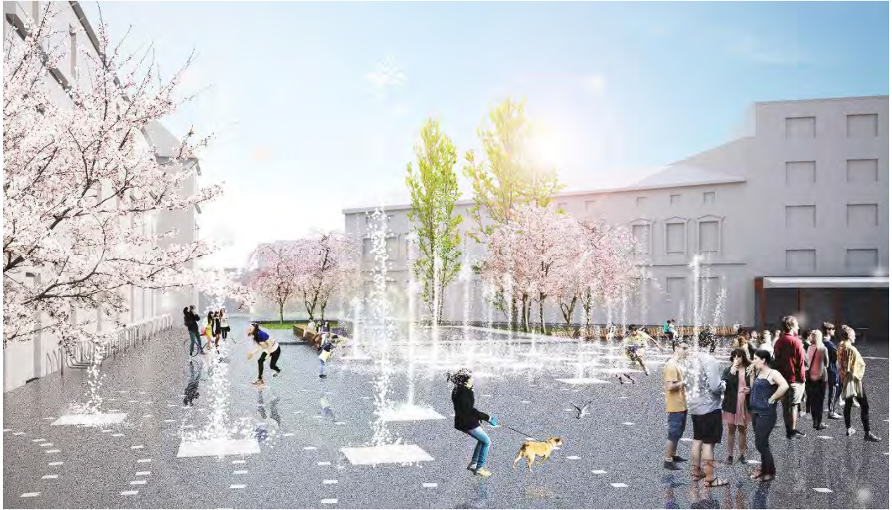
Рис. 2. Візуалізація ревіталізації площі Митної у Львові (Рисунок виконали у рамках воркшопу його учасники.)

Наступним кроком воркшопу є пошук засобів та інструментів :