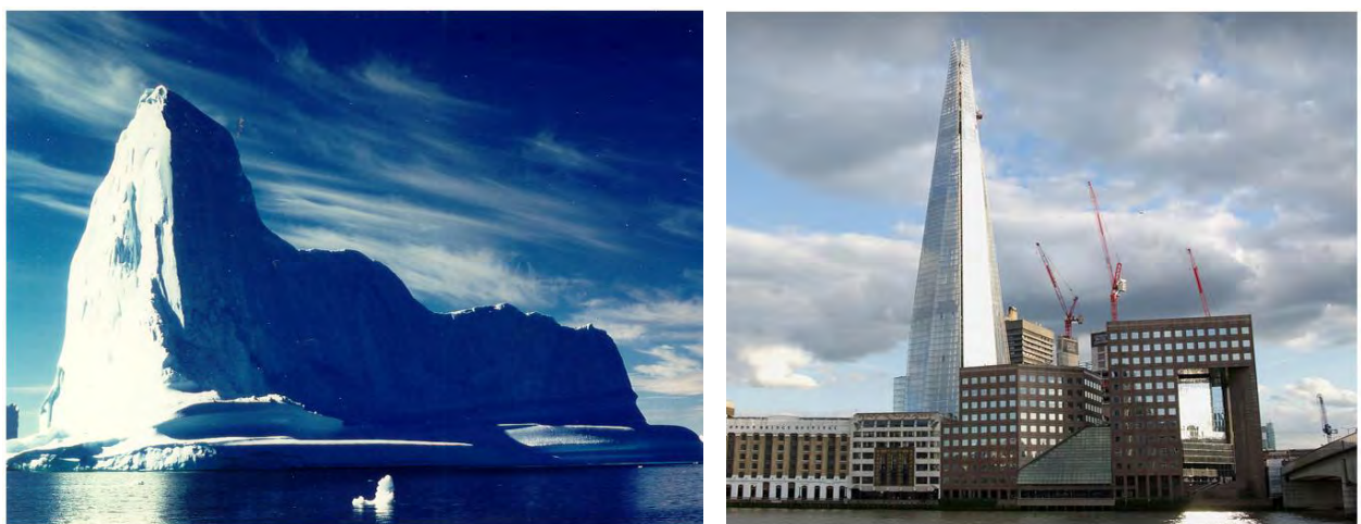
Рис. 2. Монументальна кристалічна форма у природі та висотній будівлі (Шард Лондон Брідж, 2009 р.)

Загалом, однак, під впливом індустріальної революції, відбулась зміна мистецької мови: антично-реалістичні транслятори поступились місцем абстрактним. Була створена теорія незмінної “застиглої” метафізики, котра в архітектурі доведена до своєї теоретичної та практичної вершини у творчості Міса ван дер Роє [15]. На зміну насиченій емоційності та доступній промовистості “класичного” академізму прийшов відсторонений метафізичний абсолют “героїчного” модернізму, іманентного до своєї раціонально-індустріальної суті [16]. Досягнене таким чином відчуття досконалості, що передбачало кристалізацію чистих відсторонених форм, котрі здіймались над фізичною недосконалістю та мінливістю, створили той ідеал, який отримав загальносвітове поширення і донині зберіг домінуюче становище у культурі проектування висотних будівель (рис. 2).