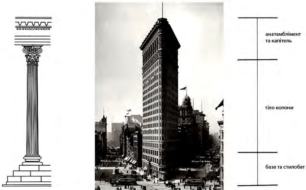
Рис. 1. Інтерпретація коринфського ордеру в хмарочосі “Флетайрон білдінг” (Нью-Йорк, 1884–1939 рр.)

теоретичній формі одним із чільних представників чиказької школи Луїсом Саліваном [13]. Хоча Саліван повторює відому тезу Анрі Лабруста про “форму”, яка має “слідувати функції” та виводить раціоналістичну схему розділення процесів як основу тектоніки, все ж, вона підкорена тридільній ритмічній членуванню римського ордеру [14] (рис. 1).