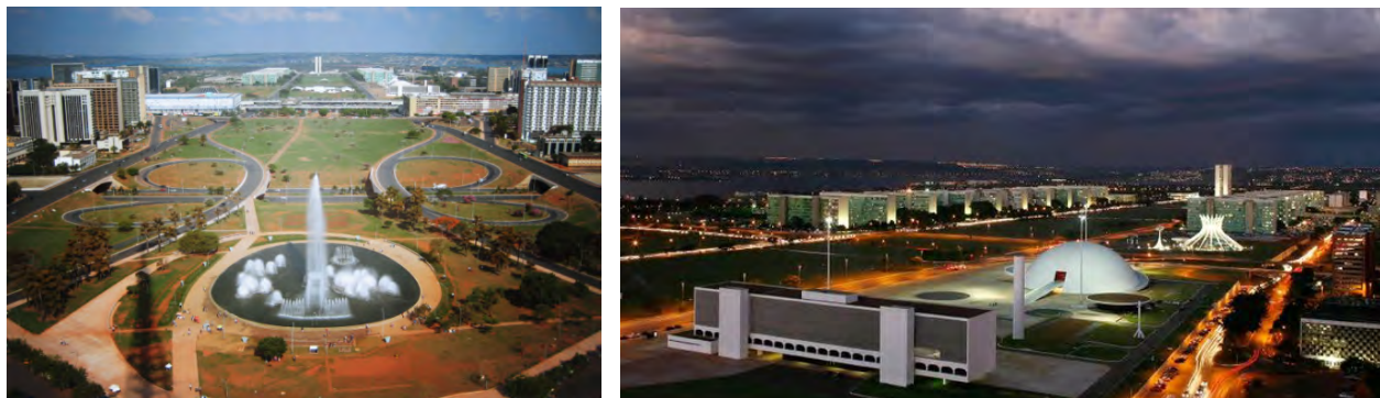
Рис. 2. Площа Трьох влад, Бразилія (Бразилія)

Поведінкові простори несуть подвійне змістове навантаження: забезпечують комфортне середовище для проживання людини і створюють відповідне місце для формування емоційного настрою [17]. Наприклад, площа Трьох влад – центральна площа столиці Бразилії, міста Бразилія, зведена за проектом архітекторів О. Німейсера і Л. Кости, інтегрує діловий, інтимний та парадний простір. У її центрі встановлений тригранний шпиль заввишки 100 м, на вершині якого майоріє прапор Бразилії площею 286 м 2 , окрім того, влаштовано водограй. Через площу проходять основні транспортні магістралі, “монументальні осі” композиції (рис. 2).