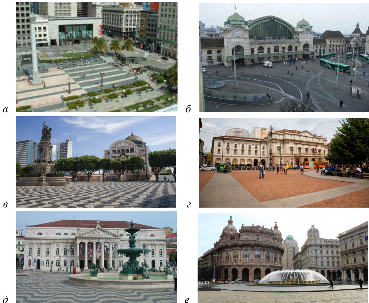
Рис. 3. Передпростори: а – площа перед торговим центром Юніон Сквер Плаза у м. Сан Франциско (США); б – вокзальна площа у м. Базель (Швейцарія); в – театральна площа в м. Амазонас (Бразилія); г – площа перед театром Ла Скала в м. Мілан (Італія); д – площа перед Національним театром в м. Лісабон (Португалія); е – площа Фераррі перед будинком фондової біржі в м. Генуя (Італія)

Як відомо, в містобудівних формах відображається міфологічне мислення та, як влучно узагальнює С. Шубович: “Подобається нам це чи ні, їх необхідно брати до уваги при побудові якої б то не було нормативної теорії”. Такі джерела міфопоетики, як “камені і вода, небо і печера, північ і південь, ознаки старіння, вісь і хода, центр і кордон – все це реалії, з якими повинна рахуватися будь-яка теоретична концепція...” [18]. Загальновідомою є роль води під час закладання міст. Містами, у яких домінують образи-символи “вода” і “камінь”, є Венеція й Амстердам, які “виростають із води” [19].