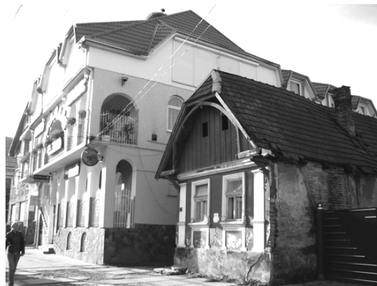
Рис. 2. Нова та історична забудова, вул. Кошута

Вирішення окреслених проблем має ґрунтуватися на ресурсах міста і відповідати його специфіці, як в історичному формуванні, так і в наміченій стратегії розвитку.