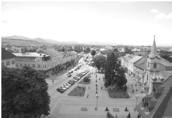
Рис. 3. Вулиця Незалежності – репрезентативний громадський простір міста Тячів

У перший день воркшопу студенти обстежили дендропарк-пам'ятку садово-паркового мистецтва місцевого значення та центральну частину смт Буштина. У місті Тячів студенти оглянули на місцевості загальноміський центр (рис. 3) та парк, багатофункціональний квартал міста, де конфліктують поміж собою різні функції, що локалізовані на цій території, та територію на в'їзді у місто, яка сьогодні не сформована як репрезентативна.