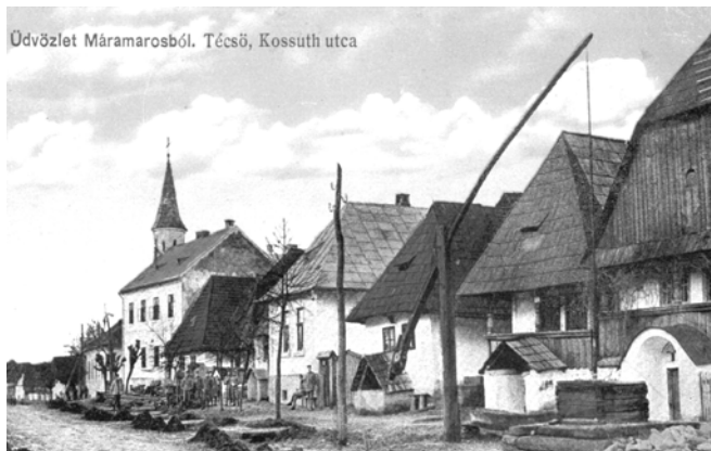
Рис. 1. Рядова забудова по вул. Кошута (Тячів, поч. ХХ ст.)

Проблемою сучасного стану є і втрата характеру історичного міста, його планувально-просторової структури. У складних економічних умовах історична забудова не бачиться мешканцями малого міста, як цінний елемент ідентичності, а лише як така, що є в незадовільному технічному стані і не відповідає місцевому поняттю престижності. Наприклад, вул. Кошута у Тячеві, що була сформована рядовою малоповерховою забудовою на вузьких парцелях (рис. 1), замінюється немасштабними новобудовами, які не лише не є якісними як архітектурний об'єкт, але і змінюють масштаб і характер середовища (рис. 2).