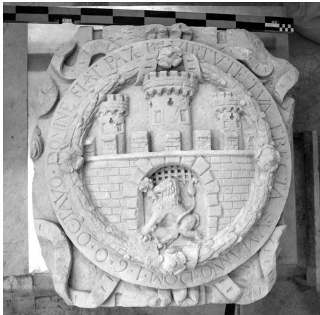
Рис. 1. Герб Львова поч. XVII ст.

Вигляд Єзуїтської хвіртки зазнавав змін. На кресленнях Дж. Бріано та на панорамі Львова поч. XVIII ст. бачимо первісний вигляд хвіртки [23, 28]. Вона була влаштована в мурі і завершувалася восьмигранною вежею з барабаном. На кожній грані вежі було вікно прямокутної форми. Вхід, пробитий у мурі, мав прямокутну форму. Припускається, що досліджуваний герб був розміщений над входом. Після перебудови хвіртка мала вже інший вигляд, це бачимо на кресленнях Ф. Пернера 1762 р. (див. рис. 2).