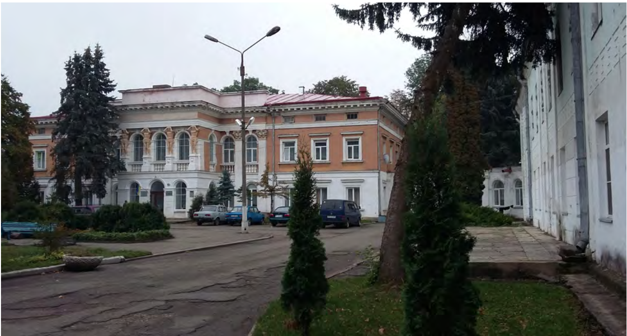
Рис. 2. Вигляд на головний фасад колишнього палацового комплексу XVIII ст. у Микулинцях, 2015 р.

Значна частина цього палацового комплексу збережена до сьогодні (рис. 2, 3). Палац стоїть у центрі парку. Його парковий фасад прикрашений восьмипілястровим портиком коринфського ордера. Звідси ландшафтний парк спускається крутими схилами до ріки, а ліворуч до нього прилягають руїни замку. У парку збереглися три двохсотлітні ясени. Палац і старі флігелі утворюють широкий двір-курдонер. Від головного фасаду кленова алея веде до Троїцького Костелу. Посеред алеї є колодязь, оточений п'ятьма віковичними кленами. Колись палац мав розкішні парадні зали з ампірними розписами на стелі. Сьогодні розписи є втрачені. Стіни приміщень колишнього палацу поштукатурені та пофарбовані.