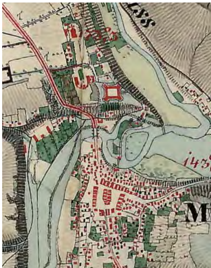
Рис. 1. Микулинці. Історична карта періоду імперії Габсбургів (1806–1869 рр.) Фрагмент [3].

Від Конєцпольських Микулинці перейшли до Синявських, від них до Любомирських. У другій половині XVIII ст. микулинецький ключ купила Людвіга з Мнішів Потоцька вдова Йозефа краківського каштеляна, великого коронного гетьмана. В той час замок існував у повному обсязі, але не був сучасною садибою. Була це масштабна двоповерхова споруда, збудована з коленого каменю на плані квадрата, кожна сторона якого мала довжину 75 метрів. По трьох кутах замку виступали потужні циліндричні башти [5]. Об'ємно-просторова композиція споруди мала яскраво виражений оборонний характер, що не відповідало новітнім поглядам того часу. Тому неподалік від середмістя у 1760-ті роки Людвіга Потоцька заклала чудовий палац з парком, який мав традиційне