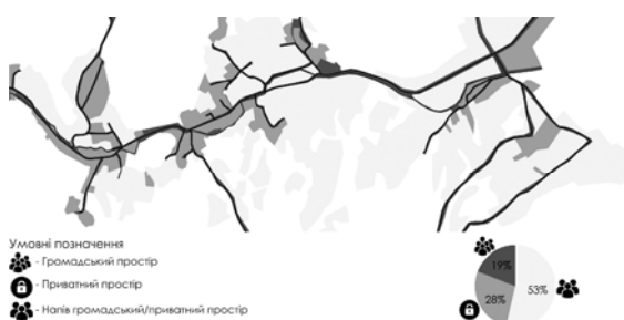
Рис. 1. Зонування села-курорту Шаян за характером використання простору

По-друге, село затиснене між двома гірськими хребтами і має лінійну структуру (рис. 2), відповідно простір села формується як транзитний простір. Довжина села – 3 350 м, а ширина коливається від 100 до 600 м. Така геометрія простору вимагає формування, окрім основного громадського центру, малих локальних громадських просторів рекреаційного чи спортивно-розважального характеру.