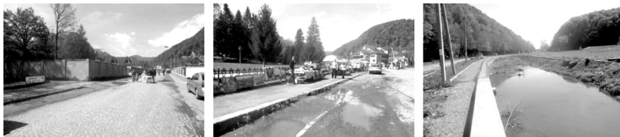
Рис. 3. Існуючі громадські простори села-курорту Шаян

Згідно з концепцією зонування лінійної структури села Шаян, пропонується виділити кілька локальних зон благоустрою громадських просторів зон вздовж центральної дороги (рис. 4).