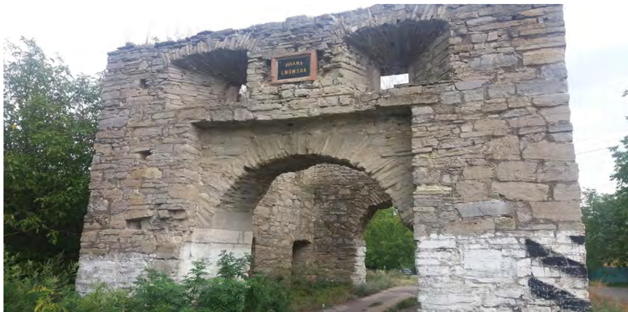
Рис. 1. Збережений фрагмент історичної фортеці “Окопи Святої Трійці” XVII – XVIII ст. Львівська брама. 2016 р.

На цьому етапі розвитку із усіх складових фортифікаційної системи частково збереженими є муровані з кам'яних блоків стіни двох в'їзних брам (рис. 1, 2) і фрагмент сторожової вежі, збережені у вигляді значних перепадів рельєфу фрагменти бастионів та куртин.