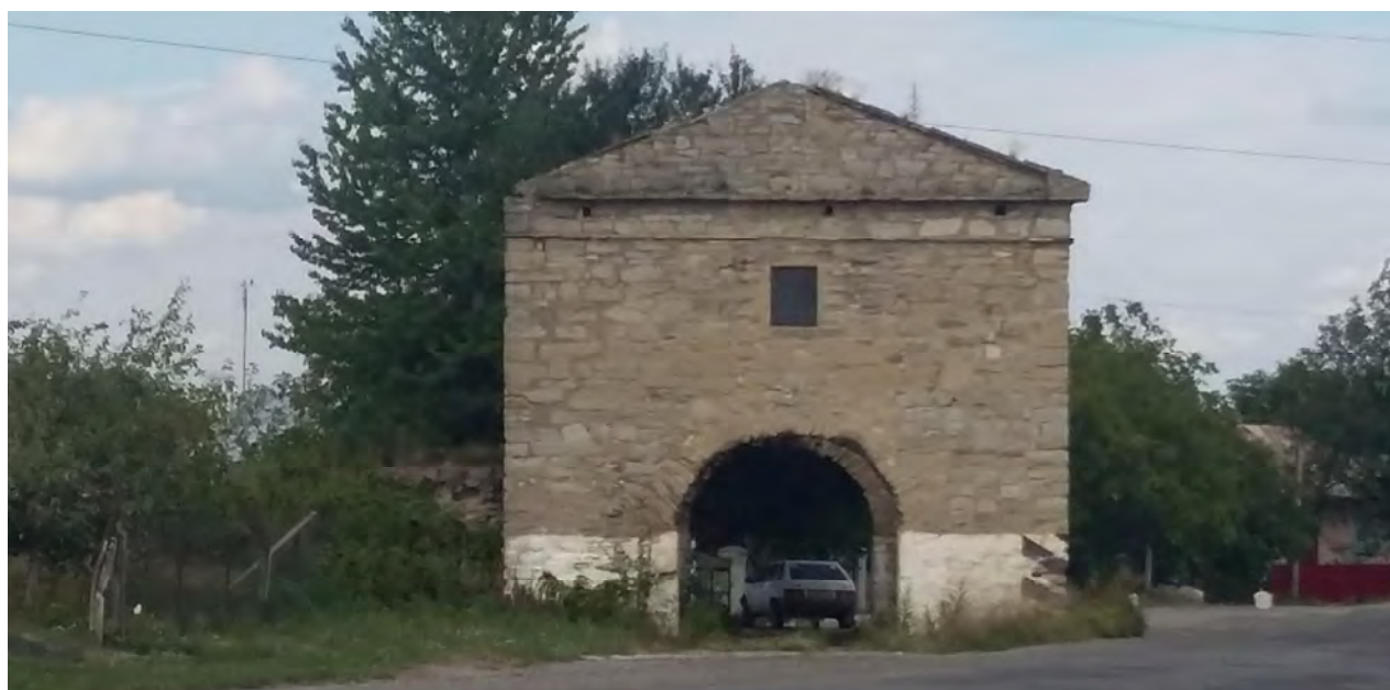
Рис. 2. Збережений фрагмент історичної фортеці “Окопи Святої Трійці” XVII – XVIII ст. Кам'янецька брама. 2016 р.