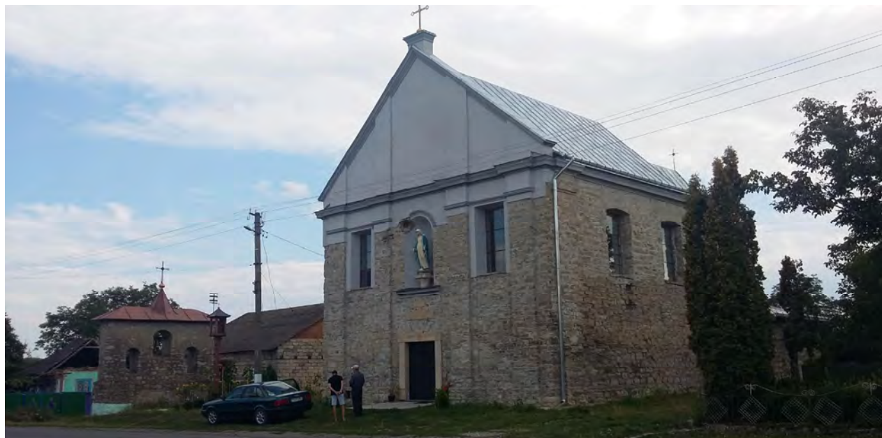
Рис. 4. Збережений частково реставрований костел Св. Трійці XVII ст. у с. Окопи (фото автора, 2016 р.)

Сьогодні склалась така ситуація, що колишня історична фортеця в Окопах, як і інші об'єкти (наприклад, замок XVII ст. у с. Чернелиця Івано-Франківської обл., фортеця у с. Єзупіль XVII ст. Івано-Франківської обл., місто-фортеця Маріямпіль XVII ст. Івано-Франківської обл. [13]) майже повністю невідомі для суспільства, оскільки рідко виникає можливість у той чи інший спосіб представити їхні збережені фрагменти на огляд широкому загалу глядачів. Також такі містобудівні утворення не мають статусу пам'ятки, а отже, не охороняються належно.