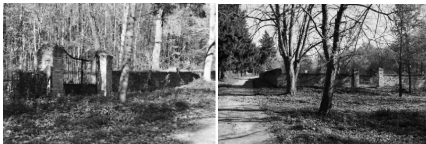
Рис. 3. Алеї парку (фото автора, 2014 р.)

III етап: включає функціональну реконструкцію історичних палацово-паркових комплексів з урахуванням сучасних вимог до функціонального зонування усього комплексу під громадську функцію.