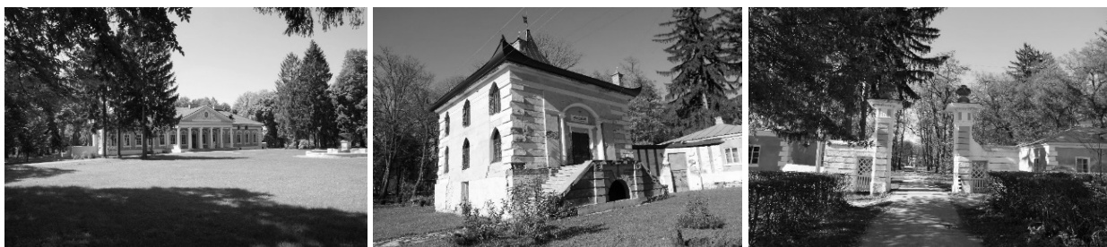
Рис. 2. Будівлі палацово-паркового комплексу: 1 – палац кінця XVIII ст.; 2 – китайський будиночок”, або “китайський павільйон”; 3 – в’їзна брама з прибрамними корпусами (фото автора, 2014 р.)

Довкола палацу у стилі класицизму знаходяться брама, прибрамні корпуси та “китайський будиночок”, який отримав від характерного для китайської архітектури піднятого краями дах. Також будиночок цікавий тим, що у підвальному поверсі розташовані льодовні.