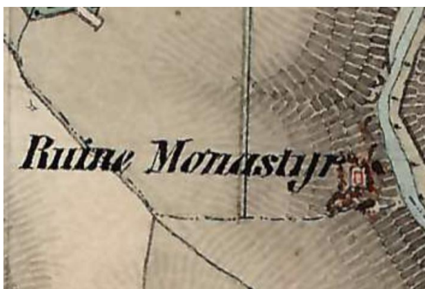
Рис. 1. Фрагмент карти австрійських обмірів (1806–1869 рр.) із зображенням руїн монастиря

Спробуємо опрацювати основні принципи ревалоризації на прикладі проектного рішення реконструкції оборонного монастирського комплексу Преображення Господнього під Бучачем Тернопільської області з пристосуванням його під паломницький центр.