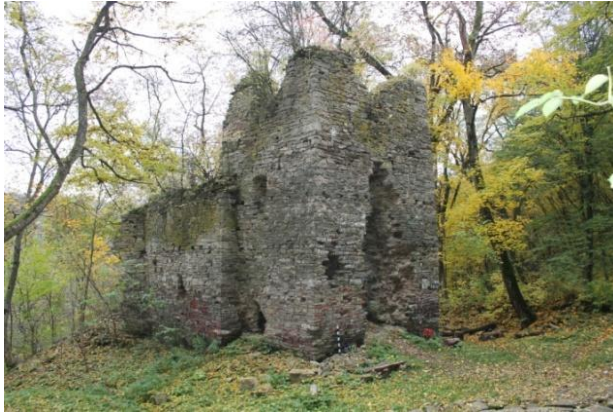
Рис. 3. Сучасний стан церкви монастирського ансамблю Преображення Господнього під Бучачем Тернопільської області (фото 2014 р.)

пам'ятки – це зони, що регламентують містобудівну діяльність у довкіллі пам'ятки з метою збереження історичного середовища пам'ятки, виявлення її композиційно-художньої цінності та доцільного використання. Наявність зон охорони пам'яток спрямовує реконструкцію населених місць, сприяє збереженню традиційного характеру середовища пам'яток і їх органічного включення у сучасне архітектурне середовище, максимальне використання композиційних і пейзажно-видових якостей пам'яток. З цього випливає перший принцип ревалоризації – принцип збереження цілісності меж .