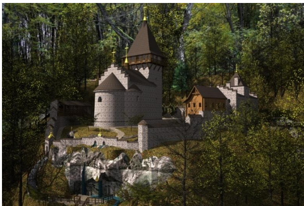
Рис. 5. Загальний вигляд монастирського ансамблю Преображення Господнього під Бучачем із навколишнім ландшафтом

Важливим елементом монастирського ансамблю є ландшафт, рельєф місцевості, а також різноманітні водойми, водоспади та інші природні або штучні елементи. Вони слугують збереженню містобудівної ролі монастирських ансамблів, а також забезпечують автентичні зони формування видів та візуальне розкриття пам'ятки. З цього випливає такий принцип ревалоризації – принцип збереження історично сформованого ландшафту .