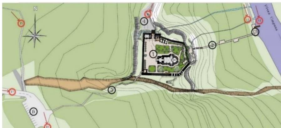
Рис. 9. Проектна пропозиція монастирського ансамблю Преображення Господнього під Бучачем Тернопільської області. (схема туристичних маршрутів)

Першочерговою проблемою під час розробки проекту було вибрати функцію для проєктованого об'єкта. Існувало кілька варіантів. Один з них – відновити монастирський комплекс з пристосуванням під духовно-освітній центр. Через те, що Буцацький колегіум імені святого Йосафата уже передбачає освітню функцію, від цього варіанта було вирішено відмовитися. Розвиток туризму та зацікавленість цими руїнами монастиря туристів та паломників, а також відсутність в Буцацькому районі духовного центру, проєктом передбачена ревалоризація оборонного монастирського комплексу з пристосуванням під паломницький центр. Ці пошуки вирішення є методом інтерпретації – базовим у процесі вироблення принципів ревалоризації архітектурних ансамблів монастирів ЧСВВ.