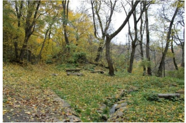
Рис. 4. Сучасний стан монастирського подвір'я ансамблю Преображення Господнього під Бучачем Тернопільської області (фото 2014 р.)