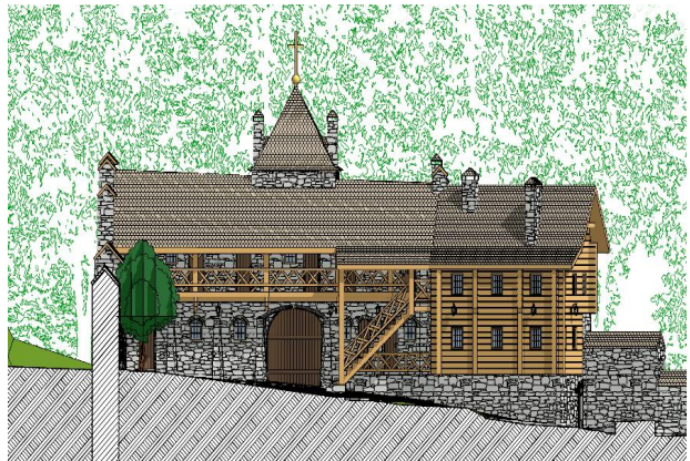
Рис. 8. Фасад монастирського ансамблю Преображення Господнього під Бучачем Тернопільської області. із музеєм та невеличким готелем для паломників

У процесі створення нової функції архітектурних ансамблів провідне місце посідає інтерпретація. Інтерпретація (від лат interpretatio – тлумачення, роз'яснення) – це тлумачення, трактування, розкриття змісту архітектурного вирішення проекту. Сприймаючи той чи інший архітектурний об'єкт, різні люди по-різному розуміють його залежно від індивідуальності, рівня розвитку, соціальної і національної належності. Твори мистецтва та архітектури, створені в минулому, завжди піддаються тій чи іншій інтерпретації у кожному нову епоху і є засобом їх "засвоєння" новими громадськими системами, людьми іншого світогляду тощо.