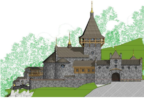
Рис. 6. Проектна пропозиція. Надбрамний корпус та церква монастирського ансамблю Преображення Господнього під Бучачем