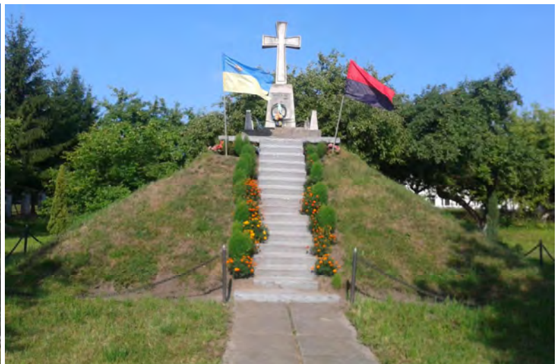
Рис. 4. Могила-пам'ятник полеглим за волю України

Отже, у повоєнні роки у центрі с. Скнилів на землях, придбаних Митрополитом Андреем Шептицьким, сформувався духовно-просвітницький комплекс, до якого увійшли: церква, дзвінниця, вхідна арка, плебанія з катехитичною школою, могила-пам'ятник, 8-річна загально-освітня школа, дитячий майданчик, фруктовий сад та старі насадження лип по периметру. Стрімкий духовний та соціально-культурний розвиток громади с. Скнилів ставить нові вимоги щодо