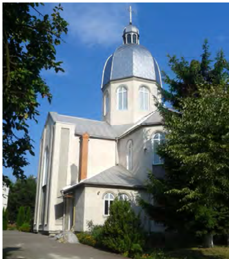
Рис. 3. Сучасна церква