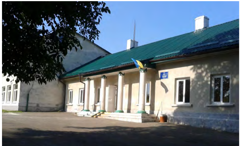
Рис. 2. Сучасна Скнилівська школа

Історично склалося так, що землі, на яких знаходиться школа, були викуплені у 1905 р. Митрополитом Андреем Шептицьким і саме перед Другою світовою війною він заснував жіночий монастир і школу при ньому для навчання дітей скнилівчан. Війна зруйнувала ці плани, проте сьогоднішня Скнилівська школа знаходиться саме на цих благодатних землях.