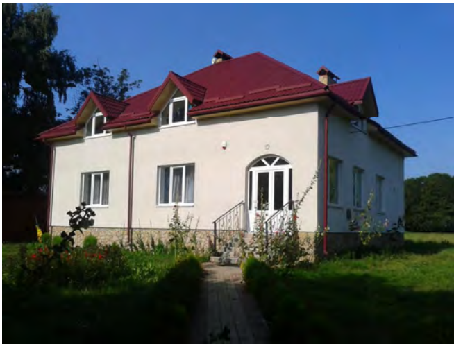
Рис. 5. Плебанія з катехитичною школою

архітектурно-планувальної організації та художньо-стилістичного вирішення цього комплексу. У перспективі заплановано спорудити будівлю духовно-просвітницького та реколекційного призначення, а також будівлю дитячого садочка. На рис. 6 показано схему генплану проектуваного Духовно-просвітницького центру ім. Митрополита Андрея Шептицького.