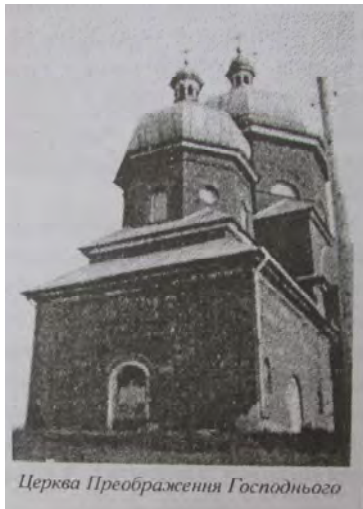
Рис. 1. Церква Преображення Господнього