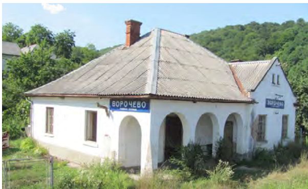
Рис. 15. Будинок зупинки у Ворочеві

Характерними для Закарпаття є малі пасажирські будинки на залізничних зупинках. Будинок зупинки Карпати має композиційну спорідненість з архітектурою однойменного санаторію – колишнього палацу графа Шенборна біля Сваляви передостаннього зламу століть, що належить до початкового періоду формування архітектури залізничних вокзалів. Поширеним є тип малих асиметричних будинків із арковими мотивами при напіввідкритих приміщеннях чи галереях, як це бачимо на зупинках у Ворочеві, Добросіллі (Бене, знищений близько 2012 р.), Невицькому, у Сіль, Цеглівці та ін., та які виконані за типовими проектами (рис. 15, 16). Можливо, вони композиційно орієнтувалися власне на будинок зупинки Карпати. Ці споруди виникали протягом наступних періодів розвитку і така стилістика є особливо притаманною для Закарпаття.