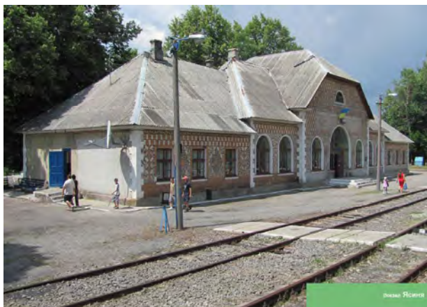
Рис. 9. Вокзал у Ясині