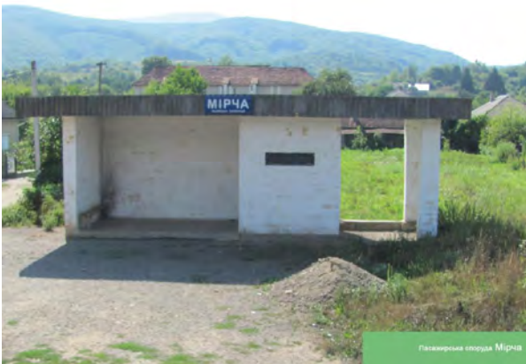
Рис. 11. Пасажирська споруда Мірча

Архітектура вокзалів Закарпаття цього часу позначається відходом від традиційних, історично зорієнтованих і типових проектів та появою споруд модерної архітектури раціоналістичного характеру. З'являються як прості павільйони-нависи, кубоподібні станційні споруди, які містять пасажирський відсік (Забрідь, Мірча, Холмок та ін., рис. 11, 12), так і індивідуальне вирішення вокзалів доволі виразної архітектури.