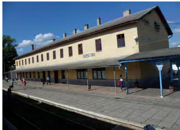
Рис. 2. Вокзал Берегово