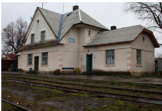
Рис. 6. Вокзал в Іршаві (фото з Інтернету)

Від часу реальної автономії Підкарпатської Русі та втрати у листопаді 1938 р. Ужгорода, Мукачева, Берегова і, відповідно, значної частини колії рівнинним Закарпаттям, український уряд складав плани будівництва залізничної колії з Хуста через Довге, Сваляву до Перечина і від Малого Березного до Пряшева, оскільки залізничний і пасажирський зв'язок з двома західнішими гірськими коліями був перерваний. Ці плани не були реалізовані через наступ Хортитських військ у березні 1939 р. на Карпатську Україну [19, с. 349–351]. Про будівництво пасажирських споруд залізниці у складі Угорщини воєнного часу 1939 – 1944 рр. говорити важко.