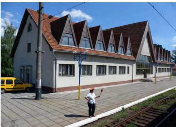
Рис. 9. Вокзал у Великій Березній

Новий вокзал у Чопі має модерну архітектуру і його прибудовано до післявоєнного. Він виконаний у лаконічних архітектурно-пластичних формах, маючи просторий і художньо оформлений касово-операційний зал, приміщення та зони для прикордонної та митної служб. Один із найвиразніших вокзалів цього періоду знаходиться у Великому Березному. Стилiстика великої споруди зі стрімкими дахами звернена до національних гірських будівельних традицій, хоча насправді таких стрімких дахів на цій невеликій території етнографічної Лемківщини на Закарпатті не існувало. У будь-якому разі це є новим і у свій час сміливим вирішенням та утвердженням української ідентичності. З'являється відчуття легкості, прозорості та вільнішого внутрішнього простору. За подібними архітектурно-пластичними мотивами виконано пасажирський будинок біля платформи у Малому Березному (рис. 9, 10).