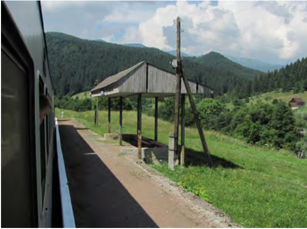
Рис. 15. Пасажирська споруда Свидовець