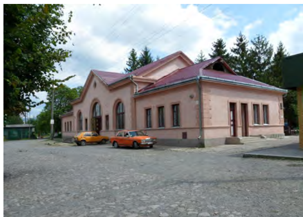
Рис. 10. Вокзал у Королево

Характерною ознакою архітектури вокзалів цього періоду є поперечна і поздовжня симетрія основного корпусу будови з фронтонами, спадисті дахи, доволі великий касовий зал, опорядження фасадів дрібною пластикою. Відчувається класичний характер композиції, загальна строгість побудови, її подібність до інших громадських будівель цього періоду.