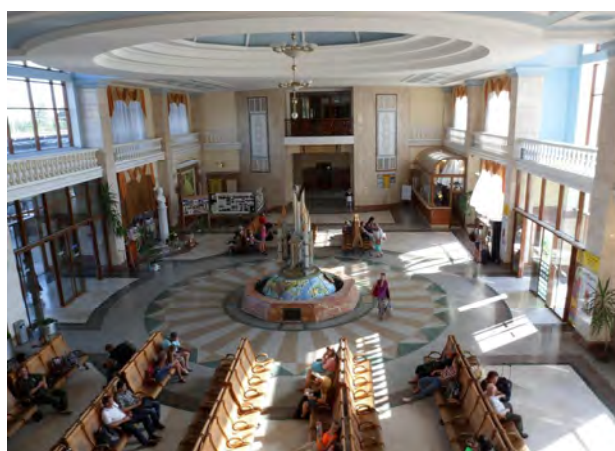
Рис. 12. Інтер'єр вокзалу в Ужгороді