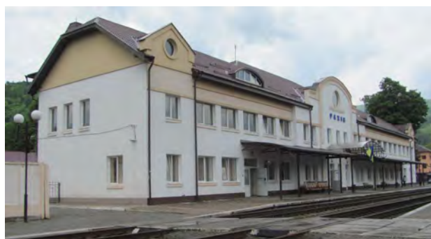
Рис. 13. Вокзал у Рахові