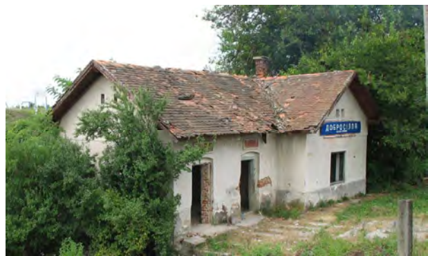
Рис. 16. Будинок зупинки у Добросіллі (Бене). Знищений близько 2012 р.