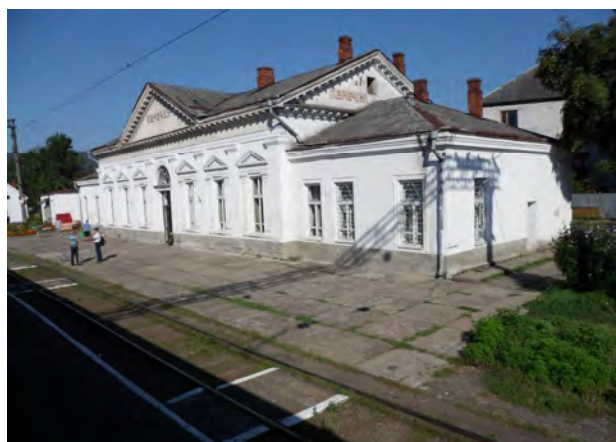
Рис. 8. Вокзал у Перечині