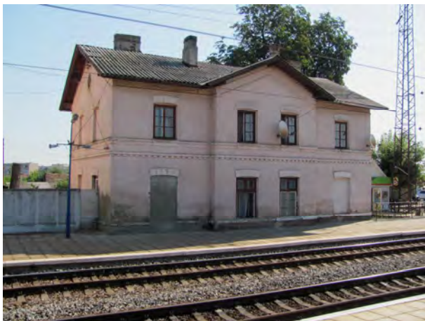
Рис. 3. Станційний будинок Батьово