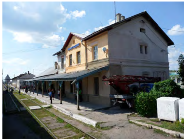
Рис. 4. Вокзал Виноградово