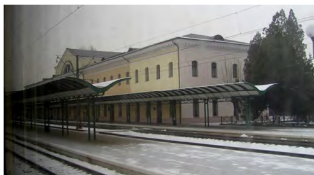
Рис. 14. Навіси перонів; старий вокзал у Чопі

Останніми роками трапляються простенькі павільйони і навіси з місцем очікування на перонах, які виконані з металевих, дерев'яних, пластикових та інших легких конструкцій: Свидовець, Ужок та ін. (рис. 15, 16). Відчувається ситуативне прилаштування таких дизайнерсько-архітектурних об'єктів, які візуально подібні до споруди зупинок інших видів громадського транспорту, і насамперед автобусного тощо.