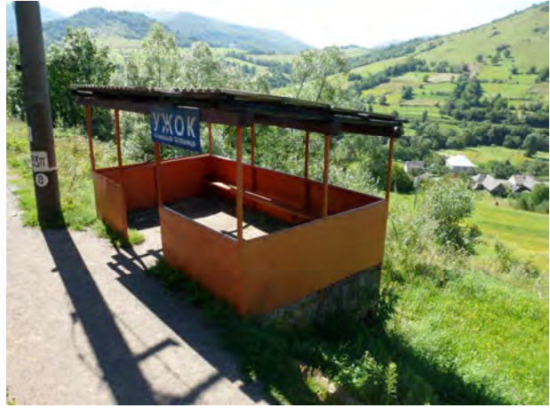
Рис. 16. Пасажирська споруда Ужок

Характерними для Закарпаття є малі пасажирські будинки на залізничних зупинках. Будинок зупинки Карпати має композиційну спорідненість з архітектурою однойменного санаторію – колишнього палацу графа Шенборна біля Сваляви передостаннього зламу століть, що належить до початкового періоду формування архітектури залізничних вокзалів. Поширеним є тип малих асиметричних будинків із арковими мотивами при напіввідкритих приміщеннях чи галереях, як це бачимо на зупинках у Ворочеві, Добросіллі (Бене, знищений близько 2012 р.), Невицькому, у Сіль, Цеглівці та ін., та які виконані за типовими проектами (рис. 15, 16). Можливо, вони композиційно орієнтувалися власне на будинок зупинки Карпати. Ці споруди виникали протягом наступних періодів розвитку і така стилістика є особливо притаманною для Закарпаття.