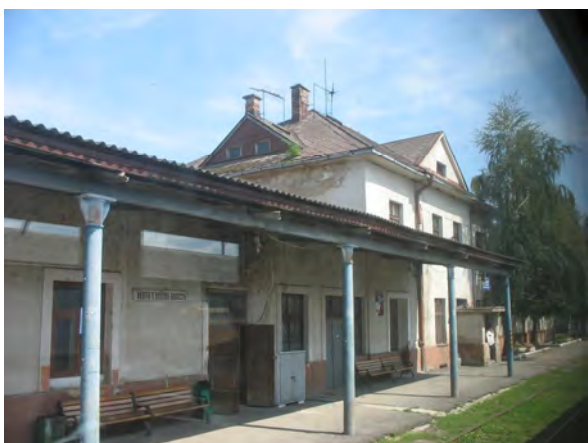
Рис. 5. Вокзал у Хусті

Найвиразніші будинки вокзалів, які бачимо сьогодні, це є вокзали у Хусті та в Іршаві, де основна споруда вокзалу зберігається, хоча спостерігаються асиметричні прибудови. Стилістично вокзали наближаються до раціоналістичних мотивів (рис. 5, 6). Аналоги у пластичному вирішенні фасадів спостерігаємо у вокзалах Словаччини.