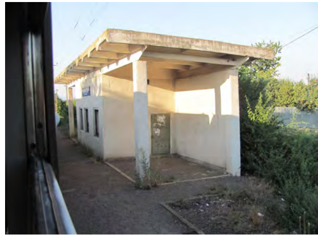
Рис. 12. Пасажирська споруда Холмок

Новий вокзал у Чопі має модерну архітектуру і його прибудовано до післявоєнного. Він виконаний у лаконічних архітектурно-пластичних формах, маючи просторий і художньо оформлений касово-операційний зал, приміщення та зони для прикордонної та митної служб. Один із найвиразніших вокзалів цього періоду знаходиться у Великому Березному. Стилiстика великої споруди зі стрімкими дахами звернена до національних гірських будівельних традицій, хоча насправді таких стрімких дахів на цій невеликій території етнографічної Лемківщини на Закарпатті не існувало. У будь-якому разі це є новим і у свій час сміливим вирішенням та утвердженням української ідентичності. З'являється відчуття легкості, прозорості та вільнішого внутрішнього простору. За подібними архітектурно-пластичними мотивами виконано пасажирський будинок біля платформи у Малому Березному (рис. 9, 10).