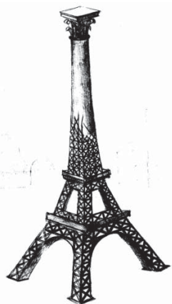
Рис. 7. “Творчий світильник”