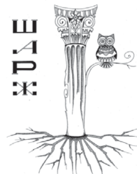
Рис. 6. “Нічний світильник”