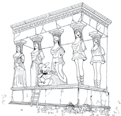
Рис. 1. “Кариатиди”