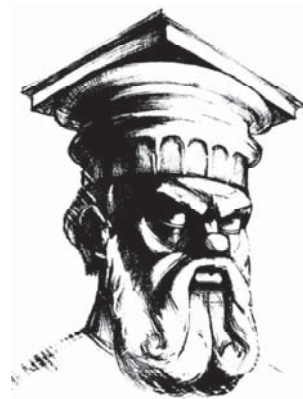
Рис. 3. Посвячення в “Зевси”