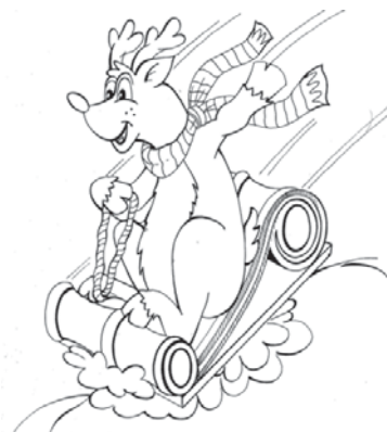
Рис. 4. “А ми на grindжолох”