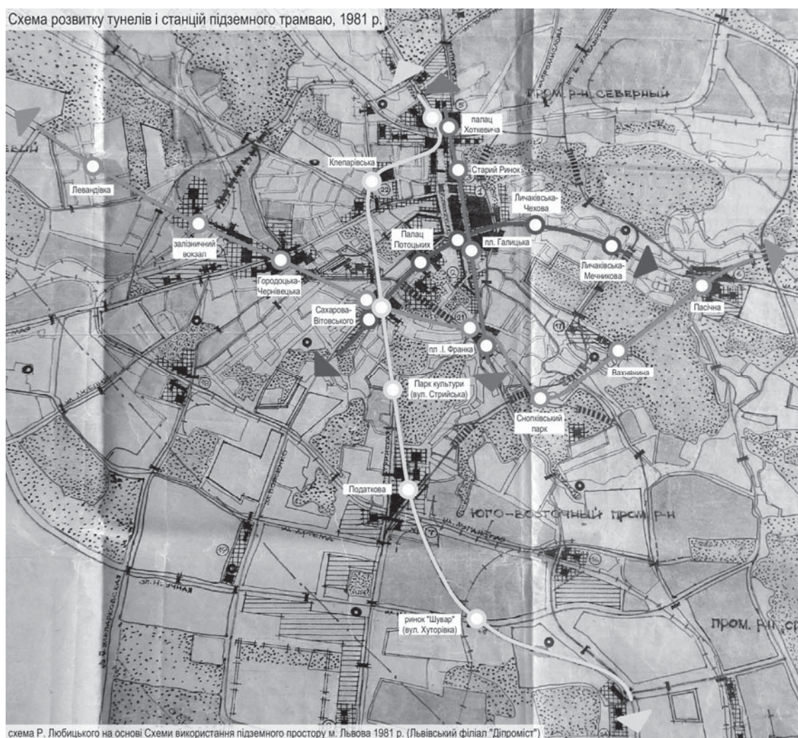
Рис. 2. Схема розвитку тунелів і станцій підземного трамваю із проекту, 1981 р. Джерело: архів ДП ДПМ “Містопроект” [3]

Концептуальні ідеї будівництва лінії підземного трамваю, окреслені у “Комплексній схемі перспективного розвитку всіх видів міського транспорту” 1975 року, уточнено проектом “Техніко-економічні основи будівництва підземного трамваю” (Український науково-дослідний інститут комунального проектування) та, підтверджуючи серйозність намірів, навіть закладено у “Схему використання підземного простору м. Львова” (1981, Львівський філіал українського державного інституту проектування міст “Діпромист”) [3]. Містобудівельники передбачали настільки сильне ущільнення населення Львова, що останній проект, окрім підземних ділянок трамваю, передбачав також розвиток інших об’єктів підземної урбаністики – гаражів, пішохідних переходів, тунелів автомагістралей і навіть кінотеатрів та закладів громадського харчування. На щастя, окремі креслення “Схеми використання підземного простору м. Львова” 1981 року збереглися в архіві ДП ДПМ “Містопроект”, що дає можливість ознайомитися і проаналізувати ці ідеї в оригінальному задумі (рис. 2).