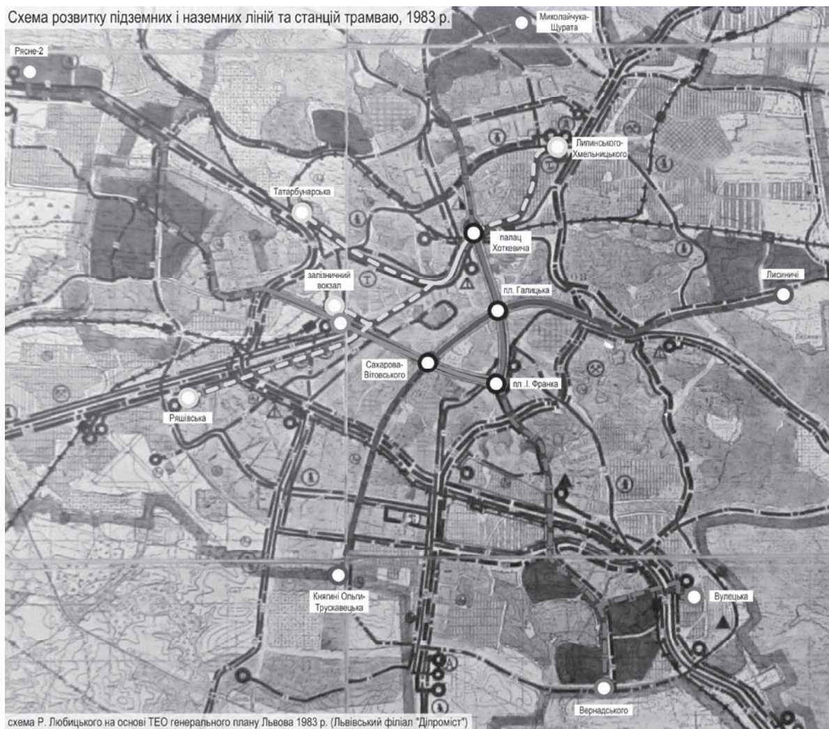
Рис. 3. Схема розвитку підземних і наземних ліній та станцій трамваю, 1983 р.

Вже за 2 роки після розроблення “Схеми використання підземного простору м. Львова” у новий генеральний план м. Львова 1983 р. на розрахунковий період до 2005 р. (1983, Львівський філіал українського державного інституту проектування міст “Діпромiст”) [4] включено змінену схему трамвайної мережі – ідею підземної лінії трамваю на Сихів замінено на наземну лінію від площі Франка по вул. Стуса і проспекті Червоної Калини, яку маємо сьогодні. Крім того, у новому генеральному плані з’явилися й інші наземні лінії трамваю, які прийшли на заміну підземним (рис. 3). Зрозуміло, що це пов’язано із вартістю спорудження підземних ліній, яка надала поштовх реальнішому проектуванню.