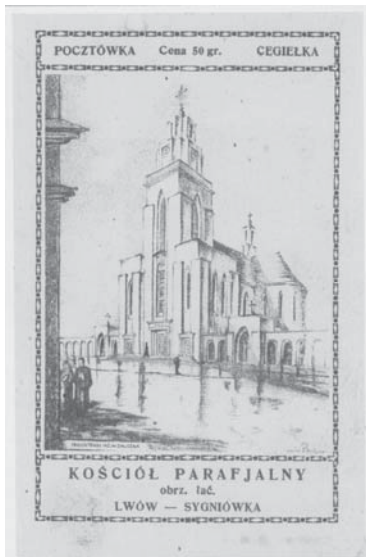
Рис. 5. Костел св. Петра та Павла на Сигнівці. Арх. Вавжинець Дайчак. 1931–1939 рр.