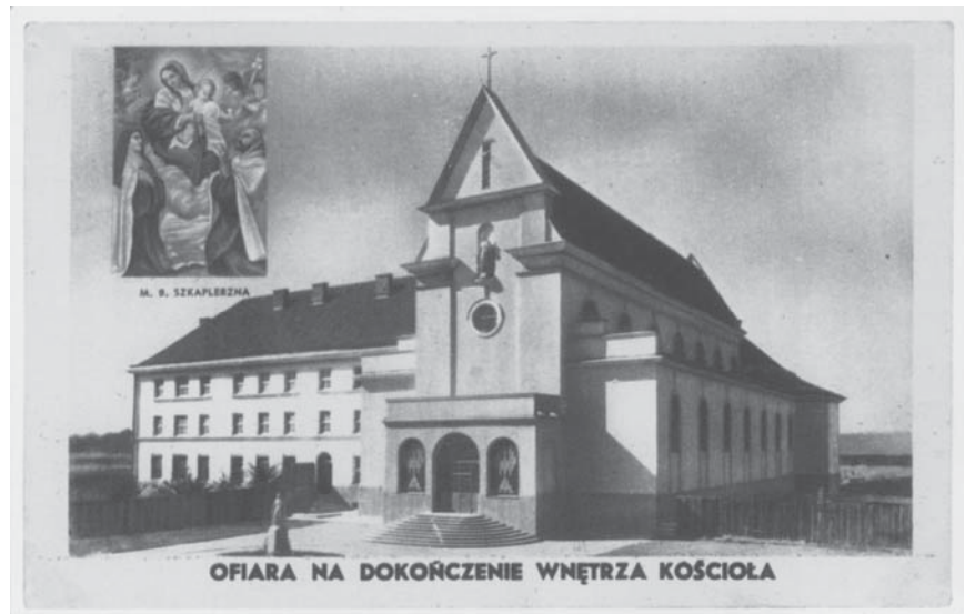
Рис. 6. Костел Матері Божої Параманної монастиря кармелітів босих. Арх. Людомил Дюркович. 1932–1938 рр. [16]

У 1914 році до активної діяльності монахи-місіонери у Львові повернулися у зв'язку з розбудовою південно-східної частини Львова та ідеєю архієпископа Юзефа Білчевського про утворення тут нової парафії і будівництва для неї костелу. Влітку 1919 р. закуплено будинок на вул. Дверницького (тепер Свенціцького), 48, ділянку для будівництва костелу і утворено комітет з будівництва. Перший проект костелу виконав відомий архітектор Адольф Шишко-Богуш. Проте з огляду на відтермінування будівництва через брак коштів та спорудження на ділянці гімназії № 8, перший проект костелу став неактуальним. У листопаді 1936 р. на засіданні комітету з будови костелу вирішено оголосити загальнопольський конкурс на проект костелу Місіонерів у Львові. На конкурс надійшло понад 20 проектів (10 – із-за меж Львова). У квітні 1937 р. в Палаці Мистецтв на території Східних торгів у Стрийському парку їх представлено на загальний огляд громадськості. До реалізації вибрано проект Тадеуша Людвіка Теодоровича-Тодоровського, який отримав тільки третє місце. Після доробок та затверджень остаточного проекту до спорудження взяли лише 15 серпня 1938 р. 1 вересня 1939 р. цокольну частину костелу – “нижній костел” – закінчено.