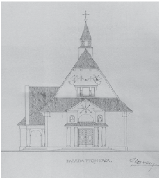
Рис. 1. Костел Матері Божої Неустанної Помочі на Левандівці. Арх. Генрик Заремба. 1921 р. [3]

наріжний камінь під храм. Того самого року, за проектом архітектора Зигмунта Крикевича, на кошти капуцинської провінції монахи побудували першу дерев'яну однонавну каплицю, яку освятили під титулом святого Франціска Асізкого [5]. Вже у 1909 р. вперше починають порушувати питання розширення монастирського комплексу та перебудови каплиці у мурованому вигляді. Повторно до цього питання повертаються лише на початку 1920 років. Для опрацювання проекту запрошено відомого тогочасного архітектора Яна Кароля Саса-Зубрицького – випускника та викладача Львівської політехніки [6]. Роботу над проектом завершено у 1921 р. Автор приділив особливу увагу стилю будівлі, що для нього, як патріота “національних стилів” закономірно. Найприйнятнішими для нього були ремінісценції польського (зигмунтовського) Ренесансу та надвіслянської готики, що асоціювались з добою розквіту держави та її незалежністю. Після затвердження проекту, у 1925 році, і закладання фундаменту та освячення наріжного каменя, розпочинають зводити мурований костел. У 1927 році, за проектом того самого Я. Саса-Зубрицького, з південного боку костелу починають прибудовувати монастирські келії. Проте все ще не задоволені проектом капуцини попросили внести свої корективи і сюди, що і зробив керівник будівельних робіт Франциск Квецінський. 5 листопада 1930 року Львівський латинський архієпископ Болеслав Твардовський освятив новозбудований храм під тим самим титулом костелу святого Франціска Асізкого [7] (рис. 2).