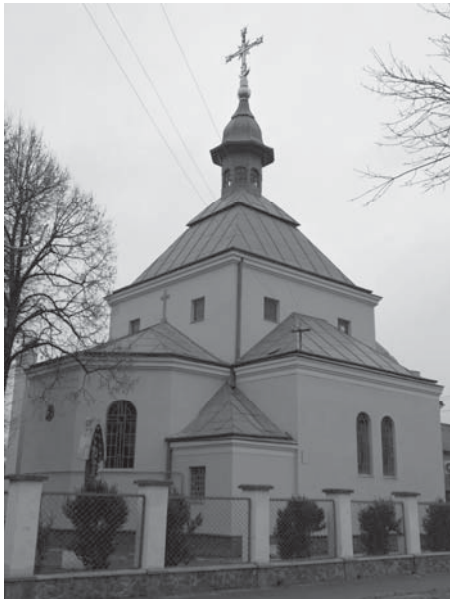
Рис. 7. Церква св. Андрія і Йосафата на Левандівці. Арх. Сергій Тимошенко. 1921–1923 рр.