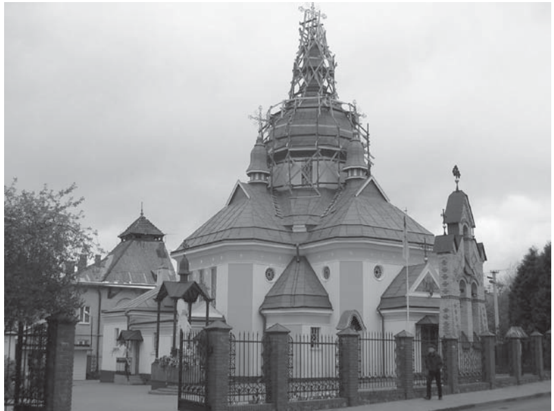
Рис. 8. Церква св. Андрія Первозванного на Клепарові. Арх. Сергій Тимошенко. 1923–1939 рр.