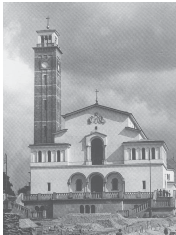
Рис. 4. Костел Матері Божої Остробрамської. Арх. Тадеуш Обмінський. 1930–1934 рр. [15]