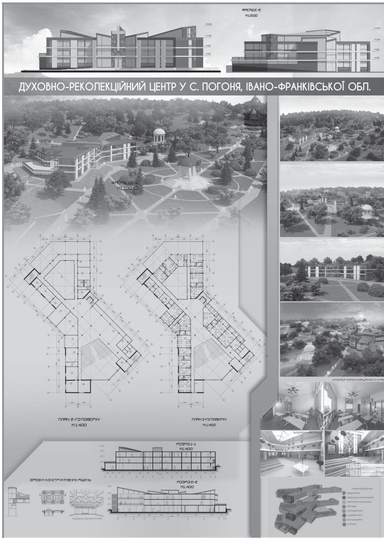
Рис. 3. Проектна пропозиція паломницького духовно-реколекційного центру у с. Погоня (арх. К. Т. Негрич (К. Т. Голубчак))