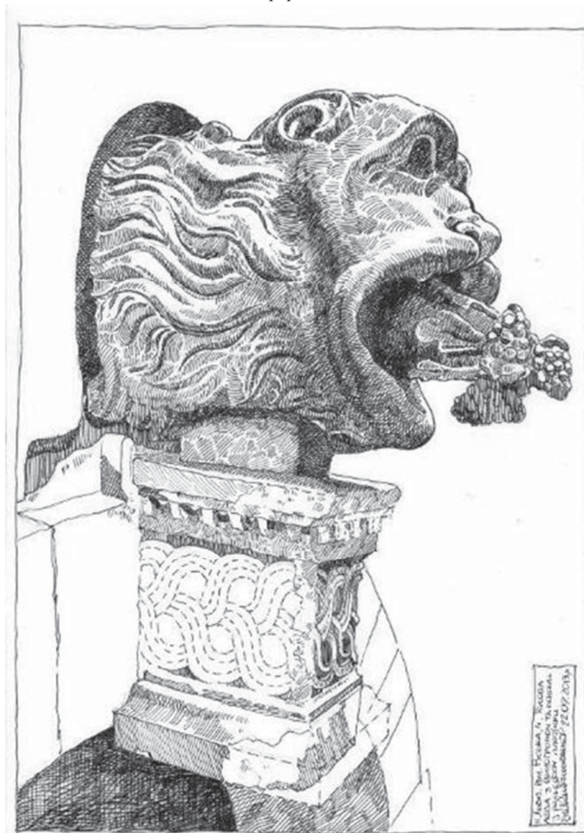
Рис. 4. Голова лева і консоль після реставрації