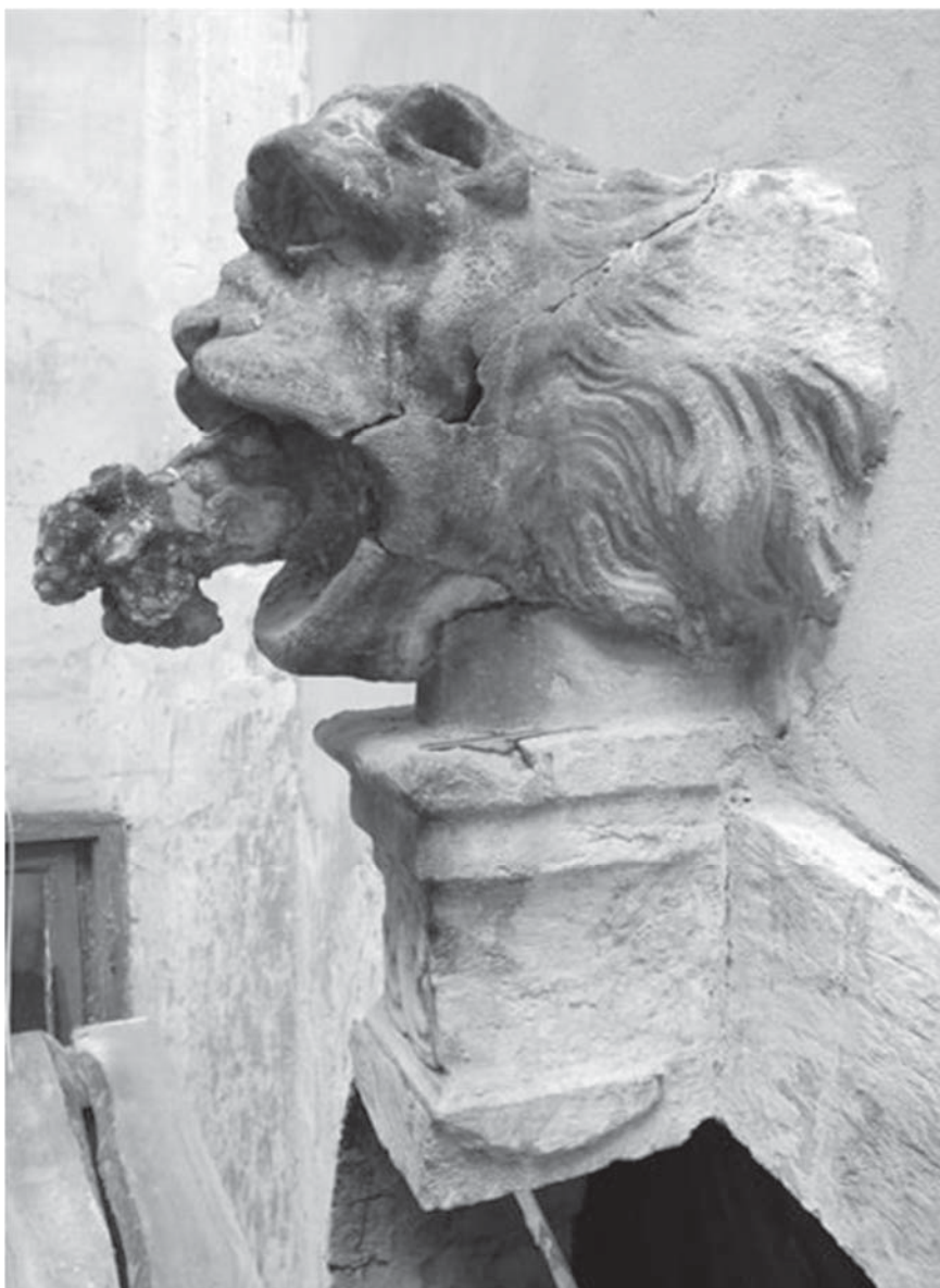
Рис. 1. Пам'ятка перед реставрацією (травень 2011 р.)

У розробленій програмі реставраційних заходів було передбачено: 1) виконання відбортуння довкола голови, консолі та кам'яної кладки арки з метою обмежити доторкання цементу до пам'ятки; 2) очищення голови від колоній мохів та лишайників; 3) очищення каменю від портландцементних перетирок та шпаклювань; 4) демонтаж винограона та скородованої та потрісканої цегляно-цементної опори під щелепою; 5) розчищення та склеєння частин щелепи та гриви; 6) очищення від портландцементу і виїняття зіржавілого металевго дроту з винограона та склеєння його фрагментів; 7) очищення автентичного залізного анкера винограона від корозії та його полімерне лакування; 8) монтаж тонкої білокам'яної стінки (товщина 5 см.) в левовій пащі та кріплення до неї винограона; 9) монтаж вапнякового кам'яного блоку-опори головою і консоллю; 10) допастування втрачених частин та сколів кам'яної кладки арки; 11) ін'єктування тріщин та приклеєння відбитих частин каменю; 12) увиразнення важливих для сприйняття частин кам'яної кладки арки; 13) реставраційне акцентування профільованих блоків та сліду від конструкції накриття прямоку сходов у півницію; 14) виконання відсолюючого компресу на голові лева; 15) структурне зміцнення каменю вапняку кремнійорганічним зміцнювачем; 16) лісирування допастованих фрагментів; 17) консервація металевго кільця; 18) покриття голови лева, консолі та нижніх частин арки біоцидним розчином.