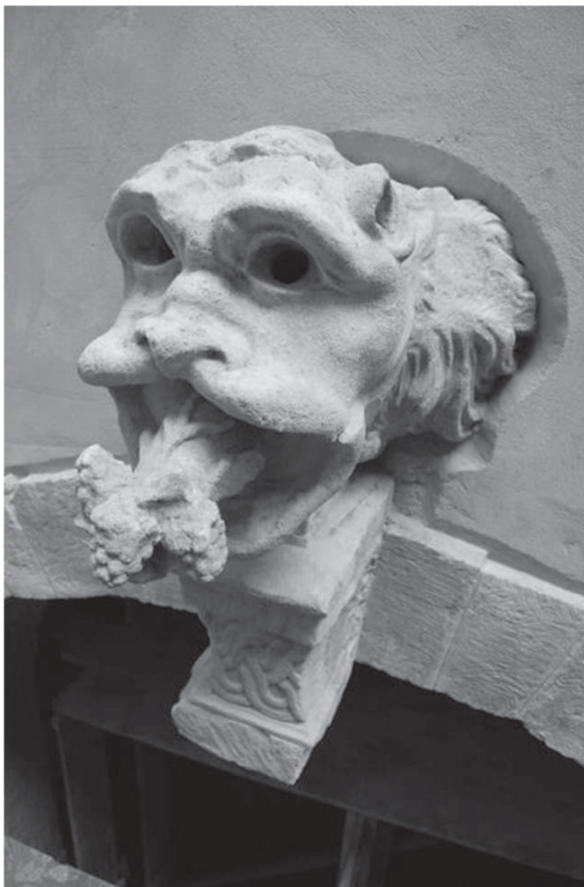
Рис. 2. Пам'ятка після реставрації (вересень 2011 р.)

Під час проведення робіт відкрилося, що внутрішня частина кам'яних блоків арки має чорну “дику” патину, яка свідчила про їхнє повторне використання. Голова лева виявилася у середині порожня, квадратна в перерізі, з товщиною стінок від 4 до 8 см. У внутрішній частині щік збереглися поздовжні акуратно вирізьблені пази (рис. 3). На внутрішніх стінках збереглися сліди від різьбярських зубил. Очі лева з наскрізними отворами, які починалися від внутрішньої великої порожнини. Довжина збереженої голови сягала одного метра. Під час обстеження вмурованої у стіну частини виявили, що вона навскіс обрубана під час демонтажу з первісного місця розташування. Консоль перед монтажем у місце замку арки підтесували і знищили лівобічну частину плетінки, на чільній стороні відрізали базу з профілем та зубчатий фриз (рис. 4). Правий бік консолі дуже пошкоджений, тому неможливо стверджувати про її оздоблення у минулому.