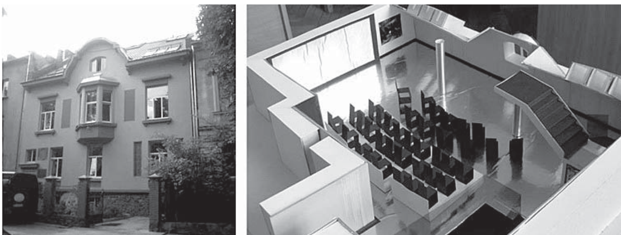
Рис. 1. Фрагменти проекту експериментального театру у просторі будівлі Львівського обласного єврейського благодійного фонду “Хесед-Ар’є” (архітектори: проф. В. Проскураков, доц. Б. Гой, ст. Н. Лісогорська), 2007 р.

Якщо ще недавно національний театр функціонував лише як частина будівель національних громад (наприклад, проект багатофункціонального театального простору, розроблений автором для єврейського товариства “Хесед-Ар’є” на вул.Котляревського у Львові (рис. 1) ще у 2007 р.).