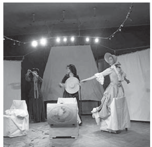
Рис. 4. Театральні вистави “Медея” та “Айсберги”, показані під час “First Trans-Atlantic Ukrainian-American Seminar on Theatre ARTS”, організованого кафедрою ДАС Львівської політехніки та Т. Р. Oakland University, США у Львівському будинку архітектора. 2009 р.