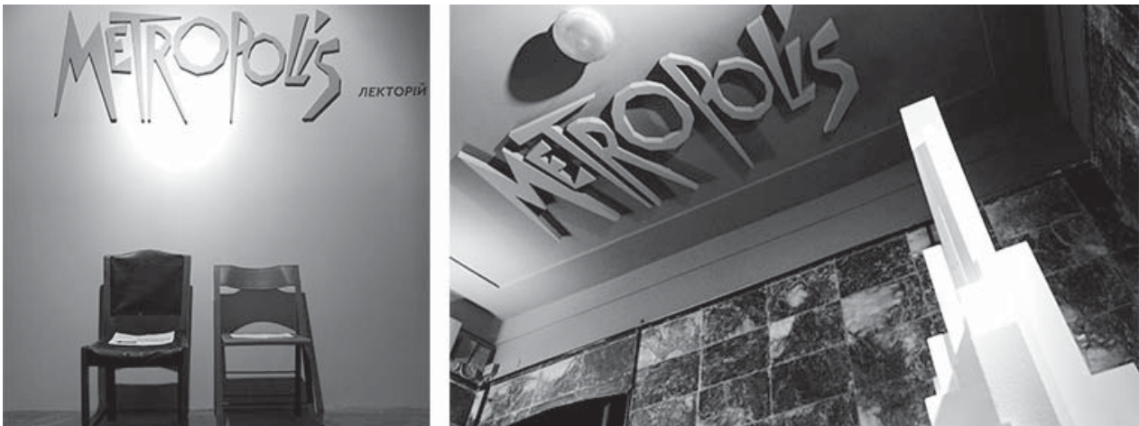
Рис. 6. Мультимедійний виставковий проєкт “Metropolis: минулі утопії майбутнього” у Львівському будинку архітектора – Центрі архітектури, дизайну та урбаністики “Порохова вежа” (куратор: П. Гудімов, архітектори: Б. Гой, О. Мочалкін). 2018 р.

Проте досвід практичної організації роботи професійного культурного центру, яким є “Порохова вежа”, а також теоретичні дослідження у сфері архітектури театрів національних громад дає автору змогу припустити, що перспективним типом архітектурних будівель та споруд, в яких зможуть у найближчому майбутньому функціонувати театри національних громад, є окремі