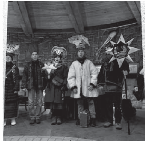
Рис. 2. Виступ колядників під час Мистецької Маланки у Львівському будинку архітектора “Пороховій вежі”, 2017 р.