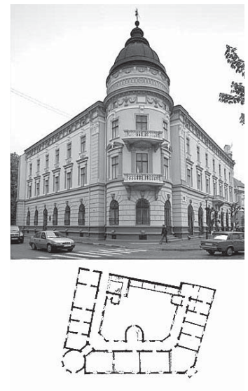
Рис. 3. Народний дім у Коломиї. Загальний вигляд. План першого поверху [17, 18]