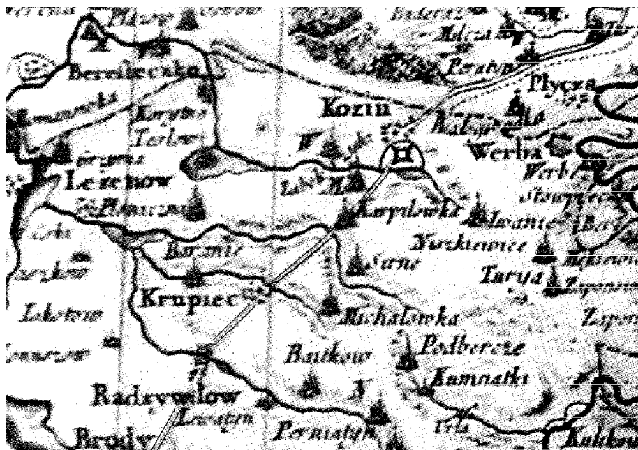
Рис. 2. Фрагмент мапи 1772 р.

Більшість замків були повністю дерев'яно-земляними. Проте протягом XVII – початку XVIII ст. вони нерідко перебудовувались на кам'яні, свідченням чого є замки у Лешневі та Козині. Цьому сприяло, зокрема, розташування їх на поживаєленому торговельному шляху на Дубно (рис. 2).