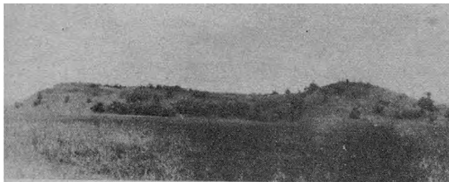
Рис. 4. Гордище у с. П'ятидні за О. Цинкаловським. Вид з півночі

Цікавим прикладом укріплення “ motte and bailey ” є городище у смт. Ратно . Особливої цінності цій пам'ятці надає можливість її історичної інтерпретації, зокрема, зв'язок городища з існуванням Ратенського князівства та становленням князівського роду Сангушків. Ратенське князівство, входячи до складу коронних земель вже з другої половини XIV ст., зазнавало відчутних західних впливів, зокрема і у фортифікаційному будівництві. Хоча насип і не зберігся до нашого часу, його надійно зафіксував П.О. Раппопорт.