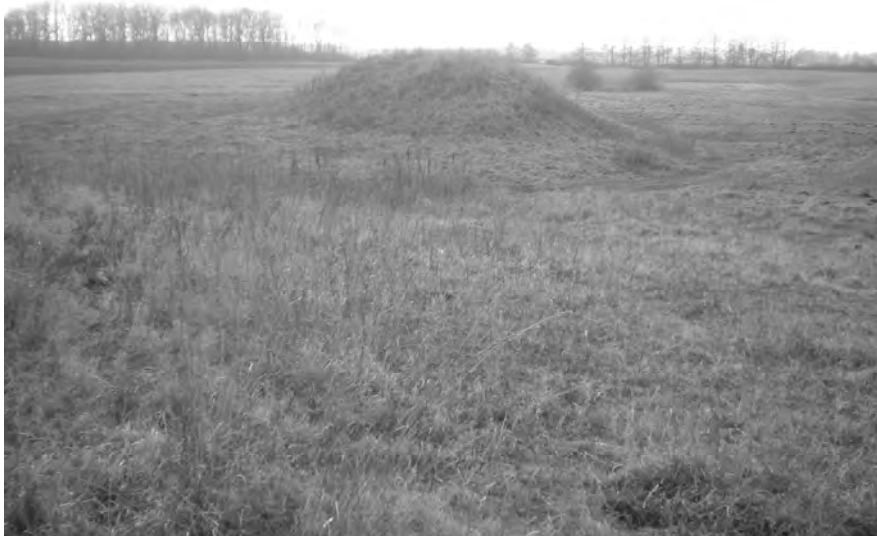
Рис. 2. “Motte” на городищі у с. Фалемичі. Вид зі сходу

Фалемичі згадані у літописі 1157 р. як Хвалимичі. С. Терський пов’язує походження цієї назви з іменем першого власника Хвала і припускає існування боярської садиби, яку локалізує на мисах східніше та північніше від сучасного села. На території городища, на його думку, у XII – XVIII ст. існувало містечко із замком [20, с. 109].