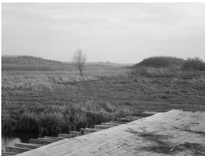
Рис. 1. Городище у с. Фалемичі. Вид з північного заходу

Цікавою планувальною особливістю городища у Фалемичах, на яку не звертали уваги попередні дослідники, є розміщення стіжка на захід від двору, у місці найбільшого зближення останцевого підвищення, на якому розміщений комплекс городища, з мисоподібним виступом лівобережної надзаплавної тераси. Тобто, за умови відсутності інших підходів, що у цій топографічній ситуації видається очевидним, на двір укріпленого комплексу можна було потрапити лише через земляний насип.