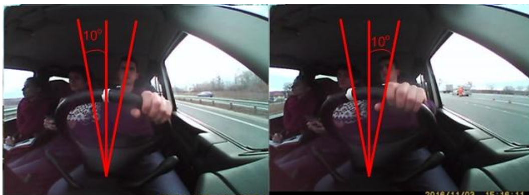
Рис. 1. Схематичне зображення методики вимірювання кута відхилення керма

Під час досліджень записували ЕКГ водія з використанням приладу “КардіоСенс”, результати якого аналізували за допомогою програмного забезпечення “КардіоЛаб”.